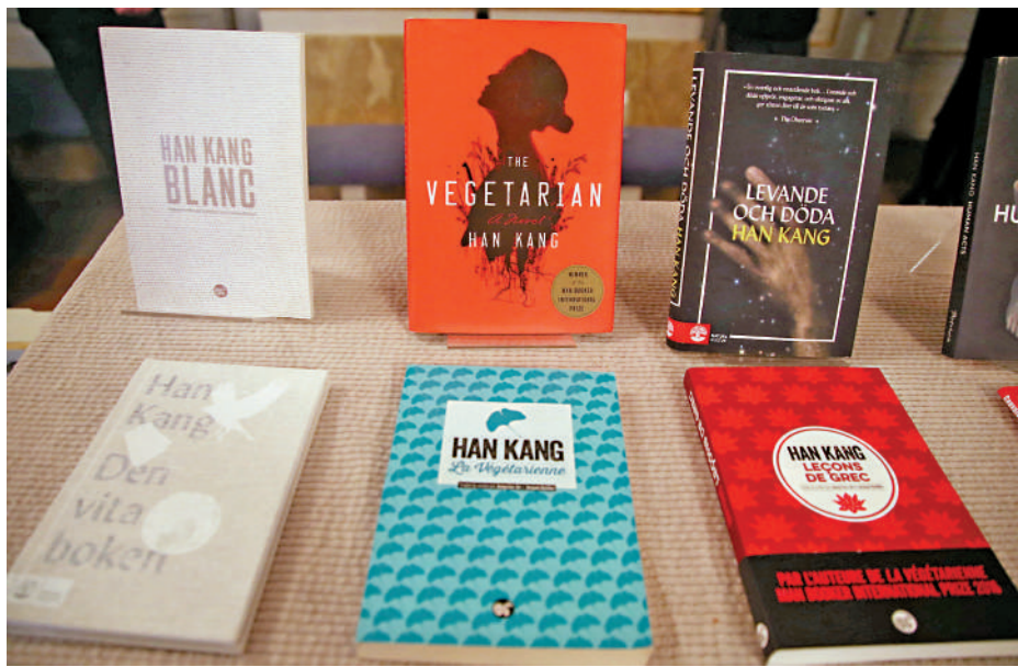
▲瑞典學院10日展出韓江部分作品。