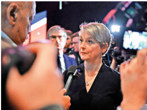
▲英國內政大臣庫珀。