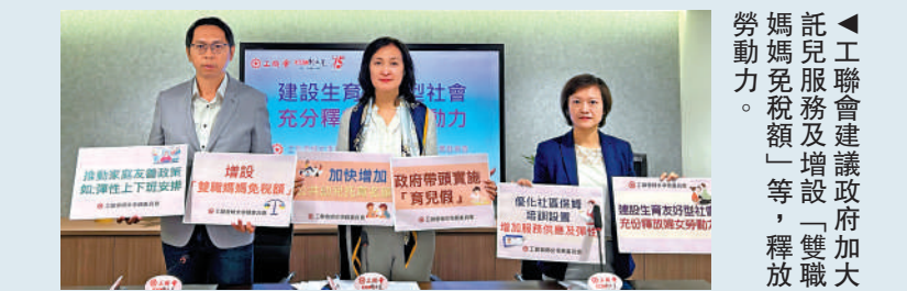
▲工聯會建議政府加大「雙職媽媽免稅額」等，釋放勞動力。