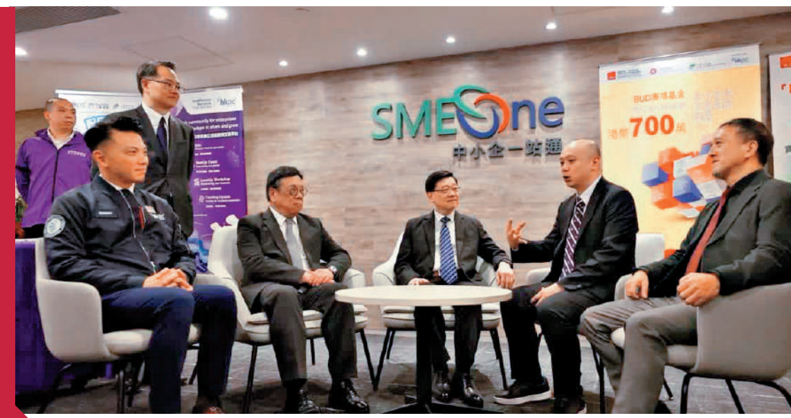
▲行政長官李家超早前到訪生產力促進局，與中小企代表見面交流，了解他們的不同挑戰及尋求轉型的需要。