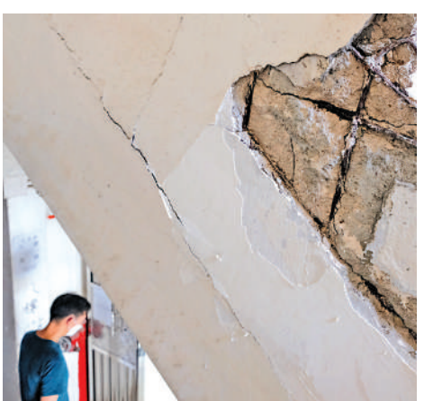
▲香港房屋經理學會建議政府研究設立強制維修基金。

【大公報訊】新一份施政報告將於下周三發表。香港房屋經理學會昨日建議，政府成立專責工作小組，統籌樓宇管理工作，包括研究設立強制維修基金、適時修訂法例，確保樓宇能及時進行必要維修保養。