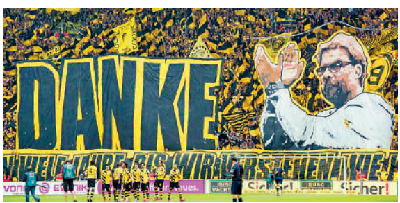
▲高洛普執教多蒙特時，廣受球迷支持。

【大公報訊】高洛普今次加入紅牛集團卻惹來德國國內大量批評，換來「偽君子」、「叛徒」等罵名，隨時千年道行一朝喪，原因是紅牛打破了德國聯賽以球會會員佔多數股權的傳統，更被標籤為「最受討厭的德國球會」。