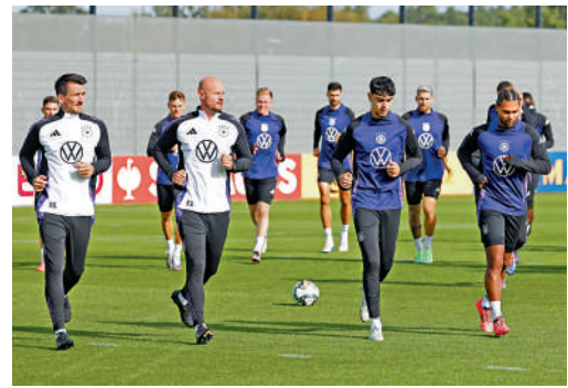
▲德國隊成員訓練中。

然而更令人感興趣的是，德國傳媒報道高洛普的合約中包括一項解約條款，列明若有球隊提出邀請其執教，高