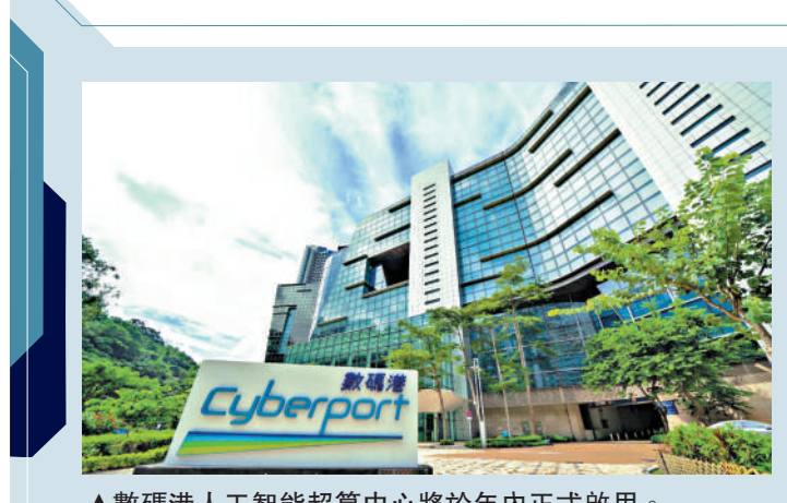
▲數碼港人工智能超算中心將於年內正式啟用。

創科路上 數碼港昨日（10日）舉辦「人工智能資助計劃」簡布會，宣布人工智能超算中心將於年內正式啟用，以及介紹資助計劃詳情，當中包括合資格用戶一般可獲得的算力資助，最高可去到數碼港超算中心服務定價的七成，有特殊情況甚至可去到九成。 人工智能資助計劃委員會主席冼漢迪線上發言表示，希望通過支持人工智能項目的發展促進本地市場增長、增加長期結構性福利和創造就業機會。 大公報記者 陳焯琛