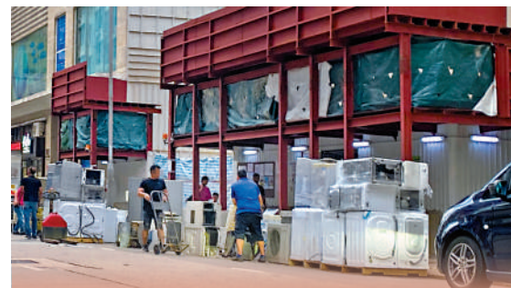
在醫局街，有人收集棄置電器，多部雪櫃擺放馬路上阻塞交通。

路，甚至行車路上擺賣，車輛駛經需閃避，十分危險，而客貨車或大貨車在上址違泊，阻礙行人視線，過路時需行出馬路，早前在海壇街，便有長者不幸遇上車禍。她說透過地區治理行動的計劃，可以跨部門處理有關問題，而在新的區議會制度下，政府部門執行的力度可以加強，因為改善地區治理、街道管理是十分重要一環。此外，她又指小販出現反映基層的需要，過往曾建議政府在區內劃出平民墟市，讓小販在受到規管、政府管理的情況下，在特定的墟市內擺賣，惟至今未得到回應。