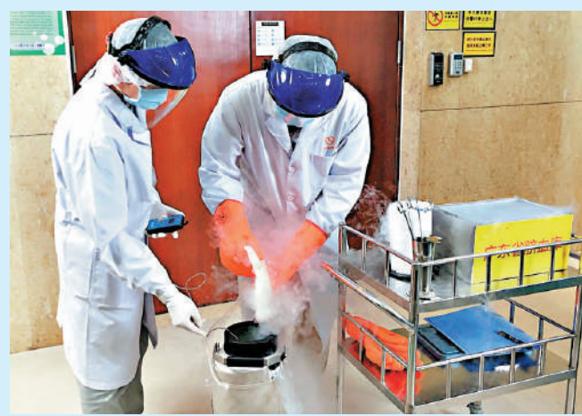
今年七月，一份臍帶血由廣州跨境來港，為患病女童治療。

擴張性心肌病變又名「擴心病」，是心肌病的一種，主要是心肌功能受到影響，其表現為心臟功能減弱，各心腔擴大，不能充分泵血。心臟科專科醫生何鴻光表示，為嬰兒移植心臟，困難之處在於選擇心臟的大小及狀態。由於祈祈只有三個月大，適合的受贈心臟很少；運送時間也需考慮，因心跳停止時間一長，心臟也會缺氧。