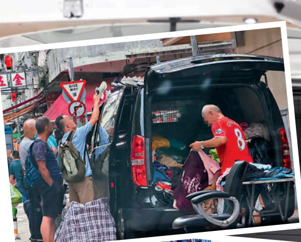
無牌跳蚤車多數是販賣衣物，吸引不少人到來挑選貨物。

警方發言人表示，深水埗警區一直關注車輛違例停泊的情況，不時派人員於區內執法，以確保道路安全及交通暢通。