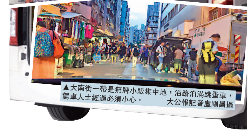
大南街一帶是無牌小販集中地，沿路泊滿跳蚤車，駕車人士經過必須小心。