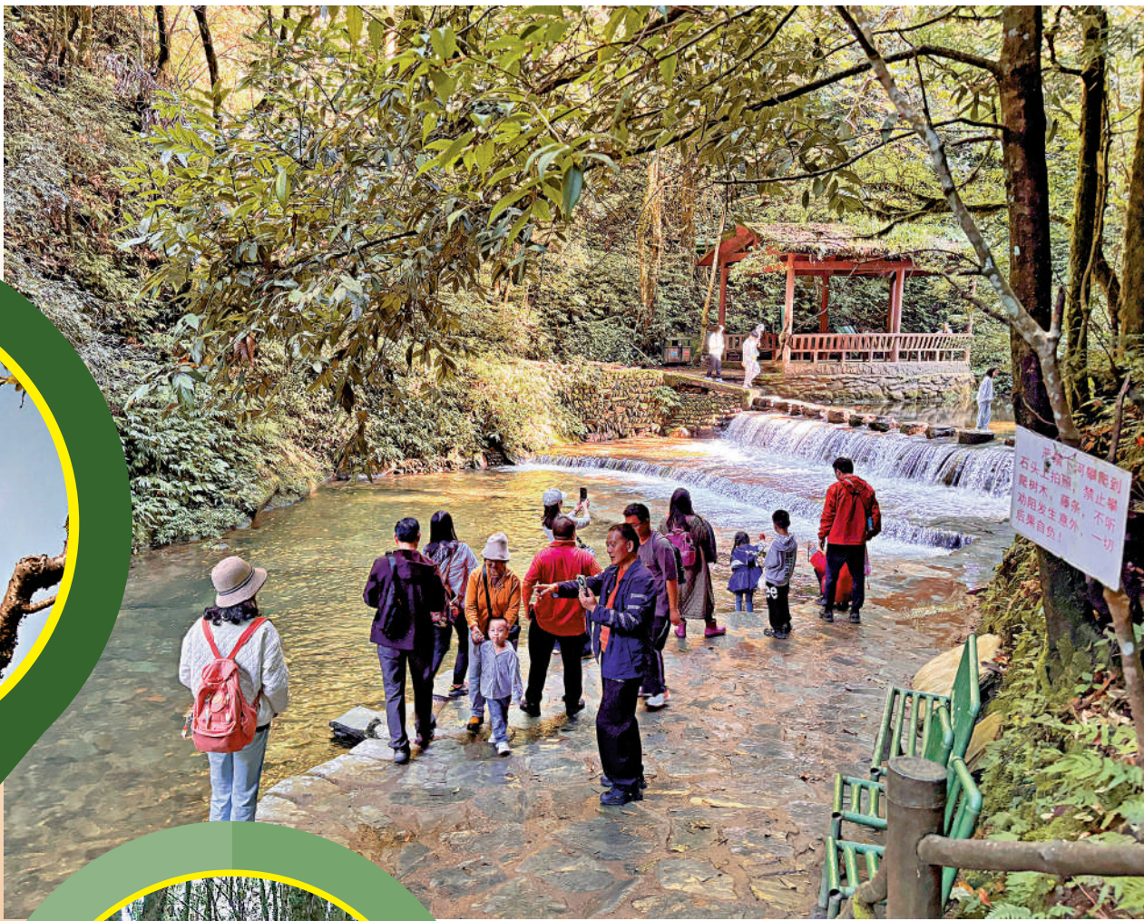
▲遊客在雲南哀牢山已開放景區遊覽美麗山水。