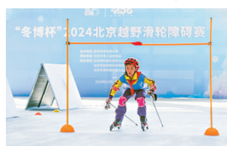
越動博覽會現場舉行「冬博杯」2024北京越野滑輪障礙賽。10月11日，國際冬季運動會現場舉行「冬博杯」2024北京越野滑輪障礙賽。

數據顯示，2023—2024冰雪季，中國冰雪休閒旅遊人數超過3.85億人次，預計該數據在2024—2025冰雪季有望突破5億人次。滑雪、冰球、速度滑冰、花樣滑冰等運動項目廣受歡迎，冰雪觀賞體驗、陸地冰雪運動持續激發大眾參與熱情。