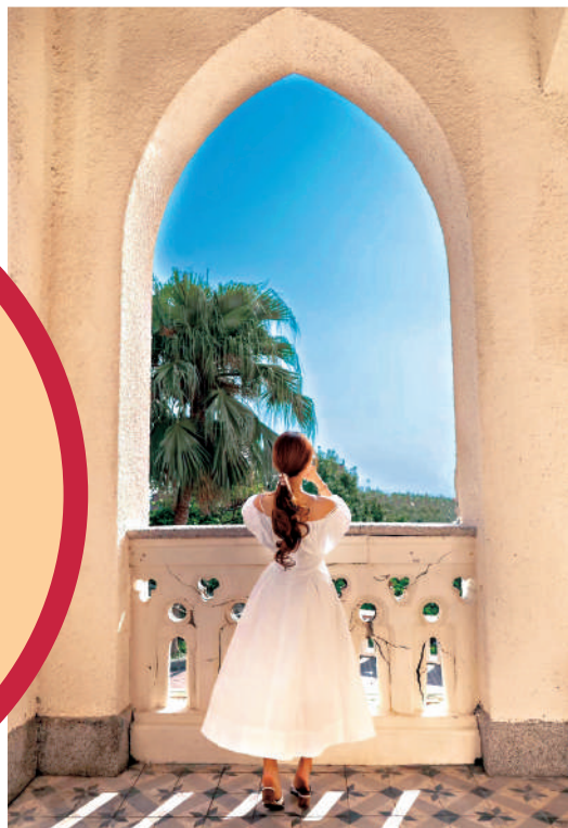
▲伯大尼吸引遊人打卡。