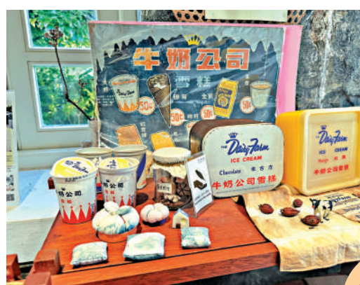
▲薄扶林農場商店內展示昔日雪糕杯、雪糕盒等。