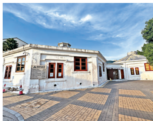
▲兩座八角形牛棚已被活化成為展覽及演出場地。