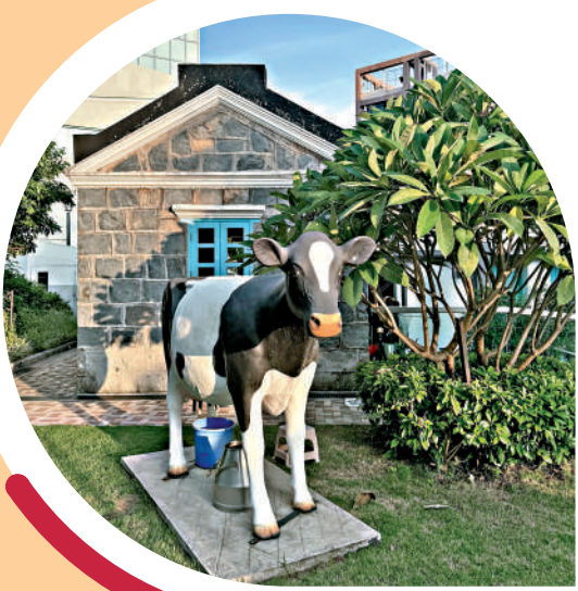
▲薄扶林牧場的奶牛打卡位。