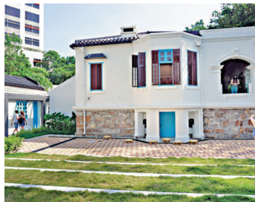
▲活化後的薄扶林農場以白、灰、藍為主色調。