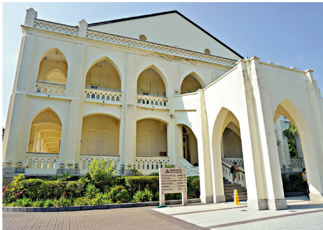
▲伯大尼修院具新哥德式建築風格。

位於薄扶林道139號的香港演藝學院伯大尼校園位於山嶺一隅，佔地18000平方米，裝飾派藝術設計的白色雙層小洋房在樹林的映襯下十分醒目。沿着國際廚藝學院的方向走便可抵達。伯大尼於1873年至1875年間建成，為傳教會士提供休養之所。因此，伯大尼是香港和遠東區第一所療養院，入口的鐵門上面的「ME」字樣是巴黎外方傳教會的縮寫。