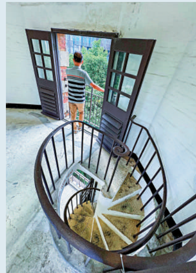
▲訊號塔內螺旋式樓梯。