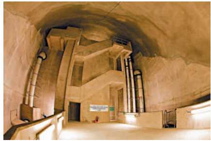
▲建於岩洞內的配水庫以往間中用作電影拍攝，今次首度開放作公開演出。