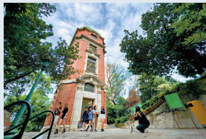
▲訊號山花園位於尖沙咀細甸臺。

尖沙咀是香港商業中心之一，客流熙來攘往，想不到還有一個遠離煩囂、寧靜而隱秘的後花園——訊號山花園。園內有一座由香港天文台於1907年興建，專向海員和市民報時的訊號塔，塔身風格是古典巴洛克混合愛德華式裝飾，以紅磚及英式砌法作牆身，2015年成為香港法定古蹟。山上可眺望維港景色，平日遊客稀少，是市民休閒避世的好地方。