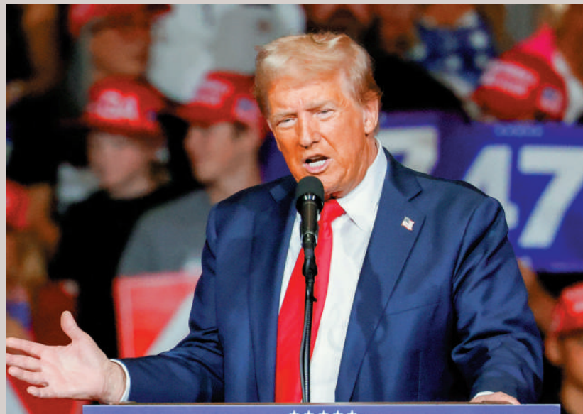
▲特朗普11日在內華達州舉行競選集會。