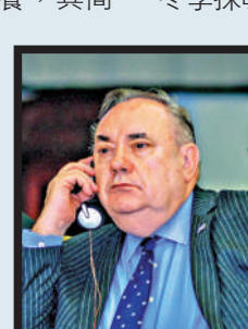
▲薩蒙德11日在北馬其頓出席活動後猝死。

《每日郵報》稱，薩蒙德去世的消息傳出前幾個小時，他還在社交媒體發文支持蘇格蘭獨立。一天前，他批評了斯塔默政府削減英國退休人士冬季採暖補貼的政策。