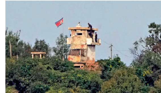
▲朝鮮士兵10日在朝韓邊境執勤。

朝鮮國防省發言人13日說，由於韓國對朝鮮首都平壤的挑釁行為，軍事緊張事態一觸即發。朝鮮人民軍總參謀部已發出作戰預備指示，命令邊境的炮兵聯合部隊和擔負重要火力打擊任務的部隊做好全面射擊準備。如果確認朝方再次挑釁，必須立即對其予以打擊。