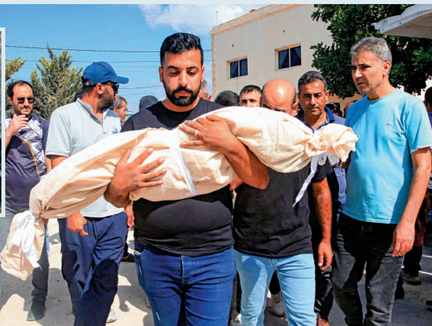
▶黎巴嫩南部民眾12日安葬在以軍空襲中身亡的家人。