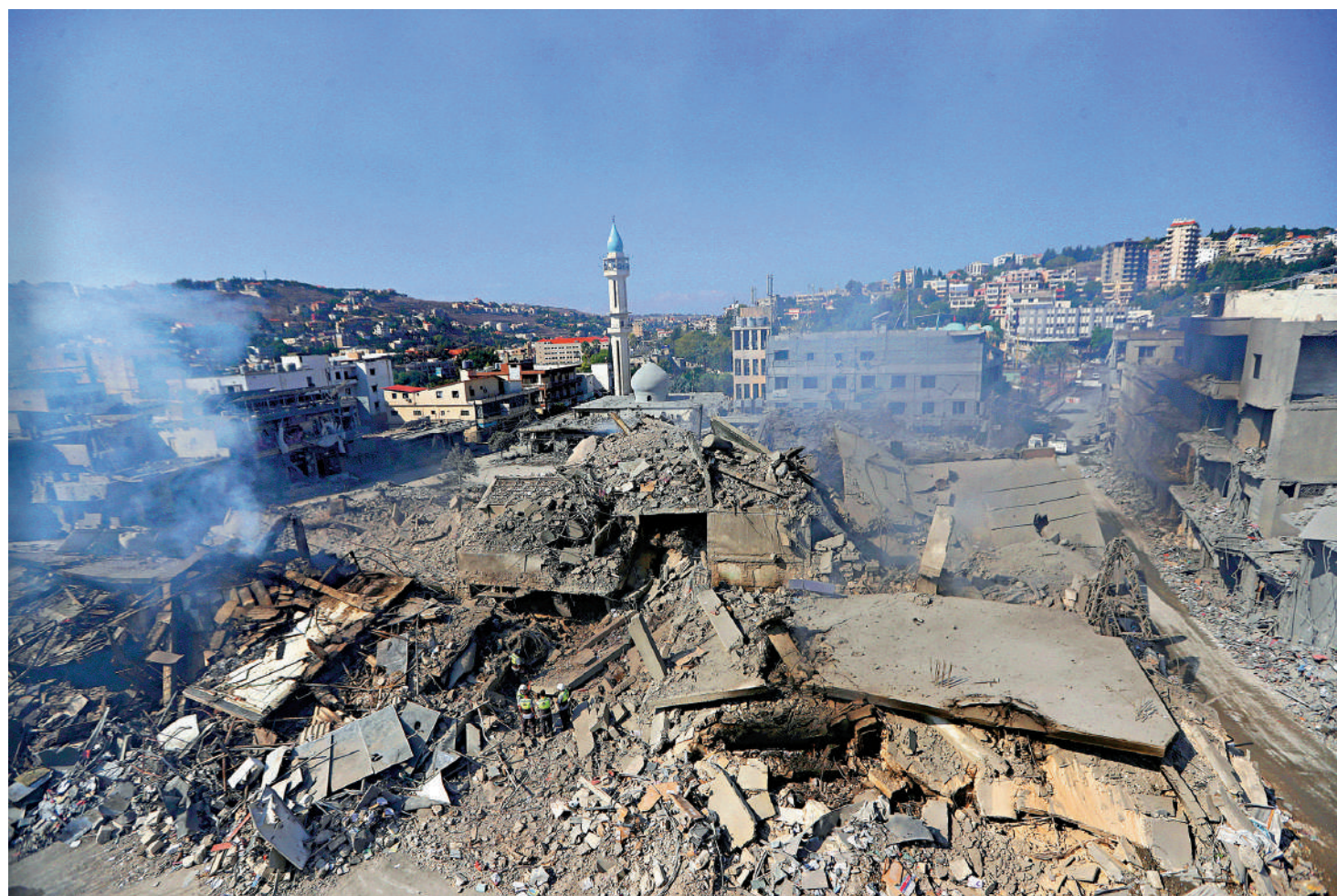
▲黎巴嫩救援人員13日查看被以軍摧毀的房屋。