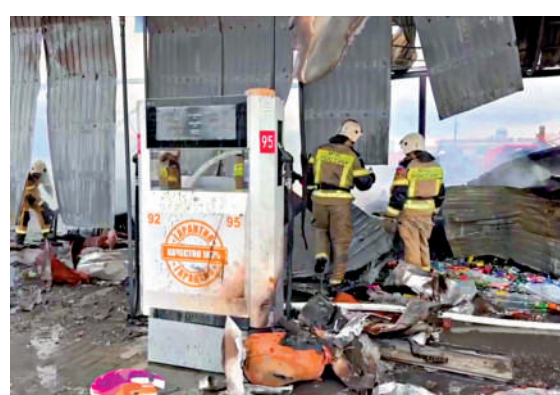
▲車臣一座加油站12日發生爆炸。

消息人士表示，初步調查顯示，爆炸原因是加油過程中違反了安全操作規程，導致起火。近來，俄羅斯北高加索地區的加油站發生多起致命爆炸事件。鄰近車臣的達吉斯坦地區曾於今年9月與2023年8月發生兩次爆炸，分別造成13人與35人死亡。