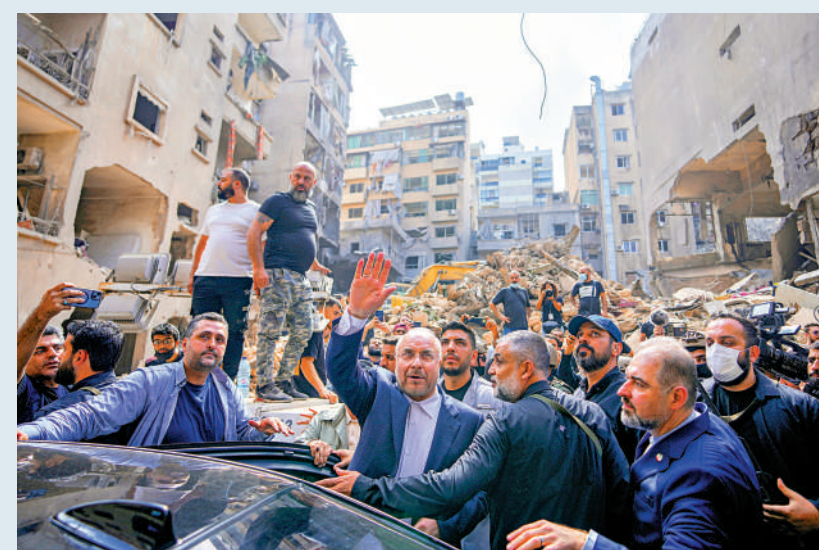
▲伊朗議會議長卡利巴夫(前排右三)12日到訪貝魯特空襲現場。

保沙特石油設施的安全。沙特等海灣國家正在游說美國，希望美國阻止以色列打擊伊朗石油設施。伊朗議會議長卡利巴夫12日親自駕駛飛機降落在黎巴嫩首都貝魯特，重申伊朗對黎巴嫩的堅定支持。