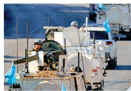
▲聯黎部隊維和人員12日在黎南部巡邏。

聯黎部隊根據安理會1978年通過的第425號決議建立。2006年8月，安理會在黎巴嫩與以色列衝突後通過第1701號決議，決定擴大對聯黎部隊的任務授權，增加兵力配備，以維護黎南部地區安全。本月10日以來，以軍多次向聯黎部隊哨塔和營地開火，造成至少5名維和人員受傷。以總理內塔尼亞胡13日聲稱，為了聯黎部隊自身安全，他敦促聯合國秘書長古特雷斯將聯黎部隊撤出黎南部交戰區域。