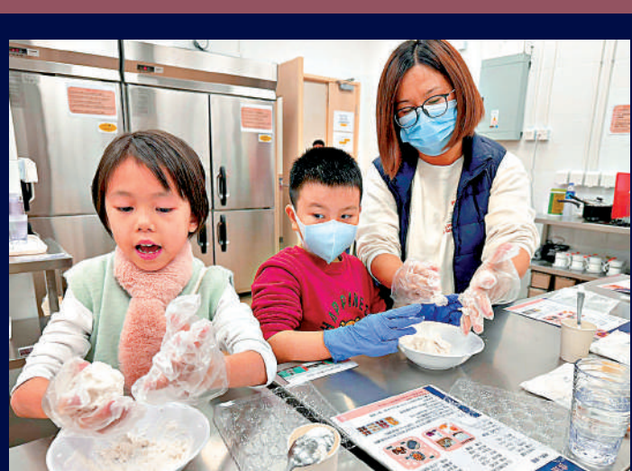
▲去年施政報告提出「社區客廳試行計劃」，為劊房戶提供額外生活空間，圖為深水埗社區客廳。