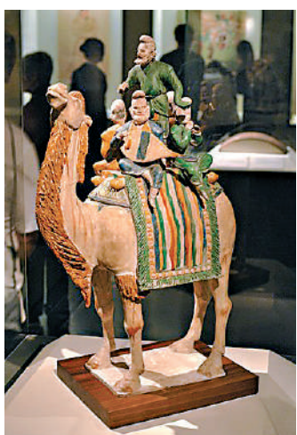
▲唐陶駱駝載樂舞三彩俑。

史學大師陳寅恪先生有言：「李唐一族之所以崛起，蓋取塞外野蠻精悍之血，注入中原文化頹廢之軀，舊染既除，新機重啟，擴大擴張，遂能別創空前之世局。」這段話指出了文化交流對於文明創造的決定性意義。《樂舞之美》以藝術考古的實證研究，再一次印證了這一論斷。書中指出，唐代對外經濟、文化交流活躍，表現「胡舞」的陶俑成為這一時期的特色。唐三彩駱駝載樂舞俑、胡人俑、雜技俑都從一個側面再現了唐代盛世文化交融的情景。