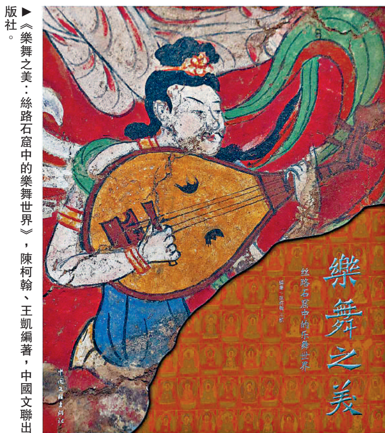
版社。《樂舞之美：絲路石窟中的樂舞世界》，陳柯翰、王凱編著，中國文聯出版社。