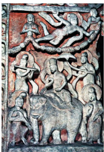
▲雲岡石窟第6窟中心塔柱上的佛傳故事。

紛呈的元素。」除了宏觀概括，書中還有對文明交流的個案分析。比如，《佛教傳播與龜茲樂舞》一文，以龜茲古國及其文明發展傳播為例，為讀者展現出中華文明圖卷中這一獨特元素。龜茲古國存在於公元前2世紀至公元11世紀，地處絲綢之路的十字路口，佛教興盛，藝術發達，印度、波斯和中原的樂舞文化在此融為一爐。玄奘在《大唐西域記》中讚嘆「管弦伎樂，特善諸國」，本書選取新疆吐魯番七康湖石窟、克孜爾石窟、庫木吐喇石窟等多幅壁畫作品，形象展示了龜茲樂舞的魅力，折射出公元383年以來其在中原傳播的盛況。如書中所言，「隨着歷史的車輛不斷向前滾動，佛教信仰在這片土地上已經被別的宗教代替，但是舞蹈這項融於生活的藝術表現形式卻被保留下來。」