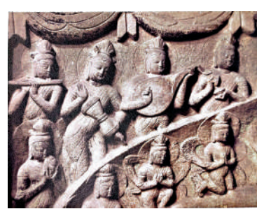
▲雲岡石窟第16窟南壁西側佛龕伎樂天。