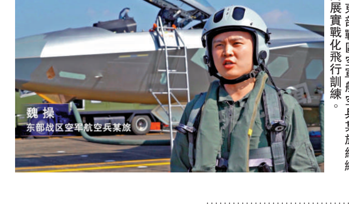
東部戰區空軍航空兵某旅開展實戰化飛行訓練。兵某旅組織

【大公報訊】綜合中新社、新華社報道：中國外交部發言人毛寧14日在例行記者會上就中國人民解放軍東部戰區開展「聯合利劍-2024B」演習表示，「台獨」與台海和平水火不容，「台獨」勢力的挑釁必然會遭到反制。如果關心台海的和平穩定，首先要做的是反對「台獨」。 外交部促美停止武裝台灣 毛寧表示，台灣是中國的一部分，台灣問題是中國內政，不容任何外來干涉。如果美方真的在乎台海的和平、穩定和地區的繁榮，就應當恪守一個中國原則和中美三個聯合公報，切實將美國領導人不支持「台獨」的承諾落到實處，停止武裝台灣，停止向「台獨」分裂勢力發出任何錯誤信號。