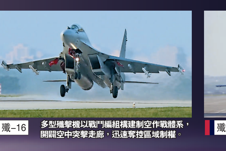
殲-16 多型殲擊機以戰鬥編組構建制空作戰體系，開關空中突擊走廊，迅速奪控區域制權。