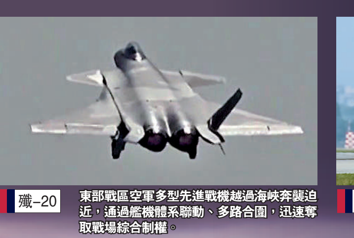
殲-20 東部戰區空軍多型先進戰機越過海峽奔襲迫近，通過艦機體系聯動、多路合圍，迅速奪取戰場綜合制權。