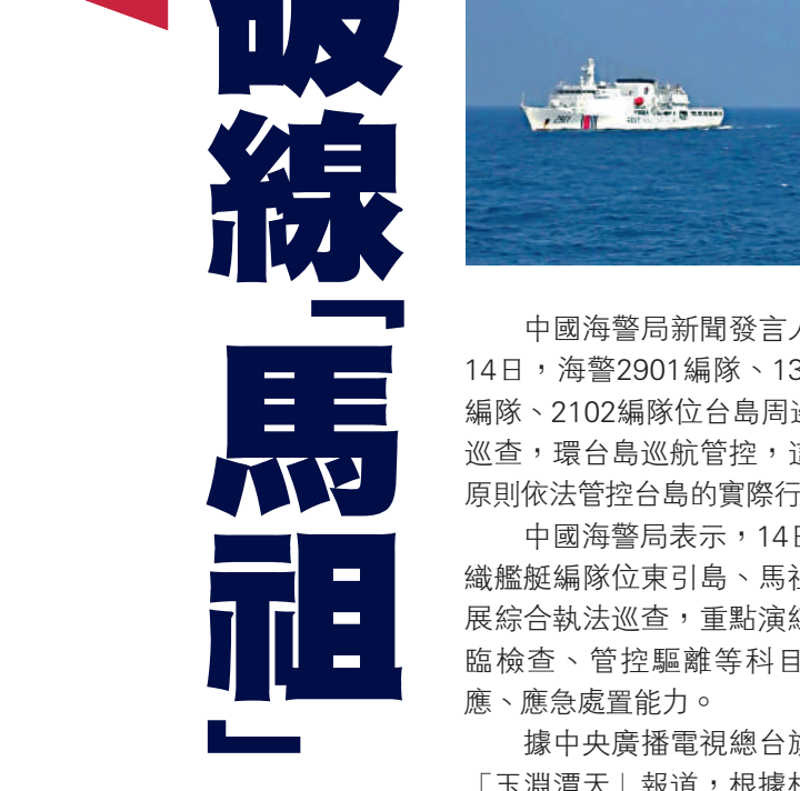
▲10月14日，多支海警艦艇編隊在台島周邊海域開展執法巡查，環台島巡航管控。