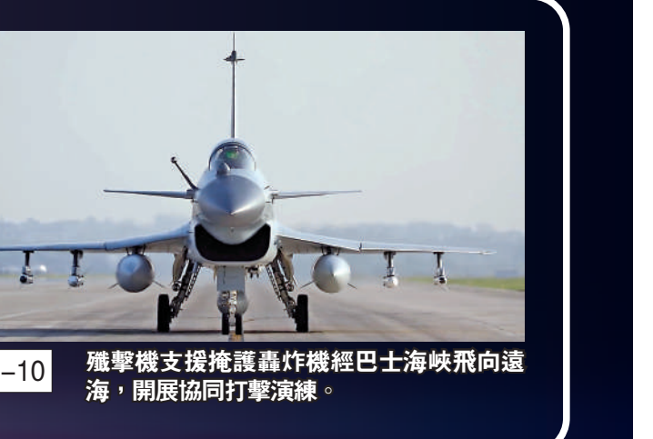
殲-10 殲擊機支援掩護轟炸機經巴士海峽飛向遠海，開展協同打擊演練。