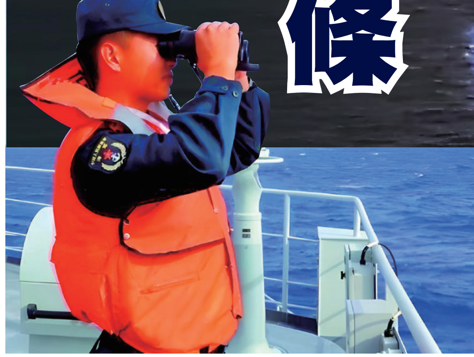
▲參與「聯合利劍-2024B」演習的海軍人員在艦上觀察海上勢態。

全方位痛擊「台獨」挑釁越甚 勒得越緊 國防大學專家張強指出，「聯合利劍-2024B演習」的6個區域好似利劍，各有用意：