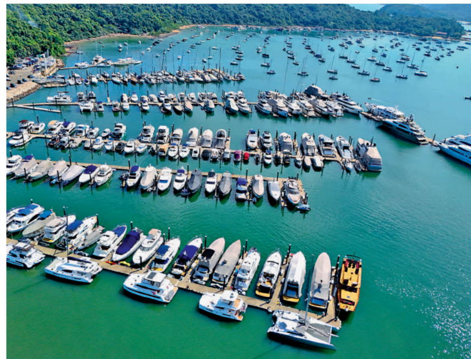
▲施政報告提出措施推動遊艇旅遊，包括邀請私人公司在三個地點建設遊艇泊位。