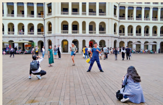
▲李家超表示，已向中央政府提出恢復深圳「一簽多行」個人遊簽證及擴大「一周一行」個人遊簽證政策試點城市範圍等。

政府消息人士表示，去年已放寬越南旅客來港「一簽多行」，即由以往需一年來港三次後才可申請「一簽多行」的門檻，放寬至過去三年內曾至少三次外遊、到訪兩個或以上的國家或地區，即符合申請資格。直至本月中，已有2500名越南旅客成功申請。放寬的門檻適用於今次施政報告提到的柬埔寨、老撾和緬甸，預計初期會先吸引到商務旅客來港。