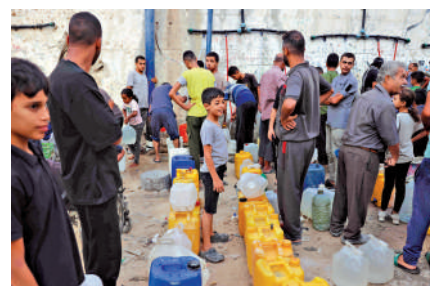
▲全球貧困地區和弱勢群體仍在面臨缺水危機，圖為加沙民眾17日排隊取水。

水循環受擾還可能對全球經濟造成重大衝擊，報告指出，在2050年底前，缺水危機可能導致富裕國家GDP平均萎縮8%，較貧窮國家的GDP則萎縮高達15%。