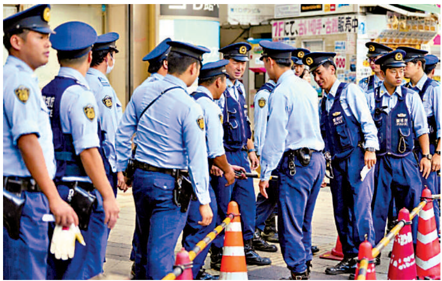
▲日本警察15日在東京街頭維持秩序。

日本靖國神社位於東京千代田區，神社內供奉有包括東條英機在內的14名二戰甲級戰犯。長期以來，日本部分政客堅持參拜靖國神社，遭到日本國內愛好和平人士和國際社會的強烈反對，也導致日本與中韓等亞洲國家關係緊張。