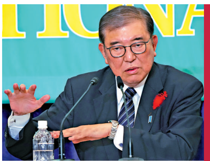
▲日本新任首相、自民黨黨魁石破茂。

日本第50屆眾議院選舉公告15日發布，選舉將於10月27日舉行。日本經濟新聞17日公布的最新民調顯示，執政黨自民黨可能無法在本次大選中獲得過半數席位，或引發日本政壇自2009年以來「從未有過的政治動盪」。日本時事通信社當天公布的民調顯示，石破內閣的支持率僅為28.0%，為自2000年以來歷屆內閣就職時最低。分析指，這表明自民黨黑金醜聞的負面影響仍在持續，日本社會對自民黨有着強烈的政治不信任感。