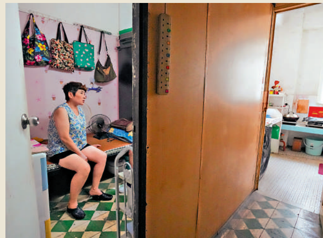
▲何女士希望政府能夠為有需要人士提供租金補助，幫助他們租到合規格的「簡樸房」。

何女士希望，政府在「簡樸房」政策正式推行後，提供足夠的公屋或簡易公屋單位，讓無法在私人市場找到合適住處的人能夠申請入住。她亦希望政府能夠為有需要人士提供租金補助，幫助他們租到合規格的「簡樸房」。