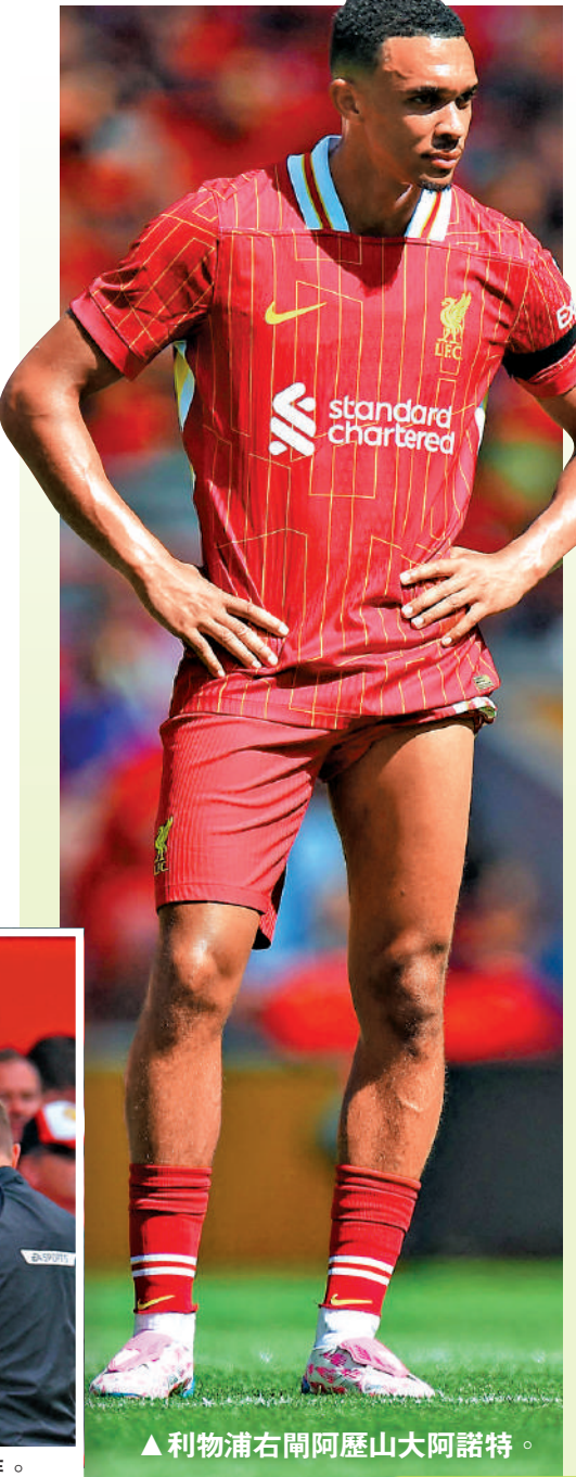
▲利物浦右閘阿歷山大阿諾特。