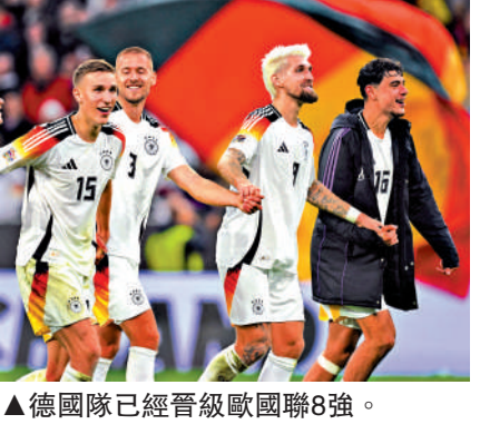
▲德國隊已經晉級歐國聯8強。

由於世界盃決賽周擴軍，世盃外圍賽由過去的10組增至12組角逐，12組榜首球隊都能夠直接晉級，因此，12個頭號種子級別(Pot 1)位置相當重要。據報德國、西班牙、法國、比利時、英格蘭、葡萄牙、意大利、荷蘭8支球隊已經確認列入第一檔次，如意大利雖未在歐國聯出線但成績出色，即使餘下兩輪全敗，都足夠鎖定第一檔次。除12組榜首球隊直接晉級外，各組次名亦會進入附加賽，連同在歐洲國家聯賽8強出線球隊外的4支最佳球隊，會分成4條路線，進行兩輪單場賽事，以爭奪最後4個名額，因此，歐洲將有16支球隊出線26年世界盃決賽周。