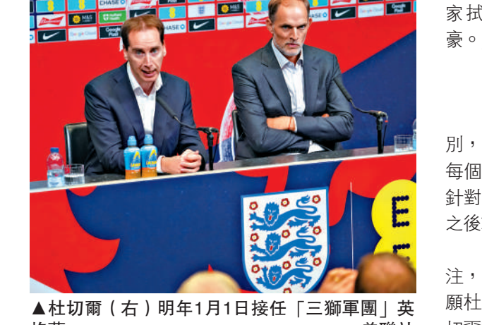
▲杜切爾（右）明年1月1日接任「三獅軍團」英格蘭。

杜切爾在英足總CEO布寧威陪同下會見傳媒，由於英格蘭主帥過去只曾出現兩名外籍教頭（艾歷臣及卡比路），不少英格蘭球迷都認為英格蘭代表隊應該由英國人帶領，故此亦不太喜歡杜切爾。因此，杜切爾在記者會立即開門見山，回應一眾英格蘭球迷說：「我要向大家致歉，我的確是名擁有德國護照的德國人，但所有英格蘭球迷都應該知道，我對英超以至英格蘭的熱情，因為我很喜歡這兒的人、工作及生活，希望大家拭目以待，我真的為成為英格蘭主帥而自豪。」