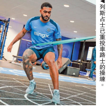
▲列斯占士已重操車路士的操練。

近日亦與另一西甲班霸巴塞隆納上關係。原來近年不斷受傷的占士，獲醫療人員告知其體質適合在一些較溫暖的地方比賽，可減少受傷並延長職業生涯，而據報其經理人就曾初步接觸巴塞和葡超的賓菲加，尋求「另類出路」。