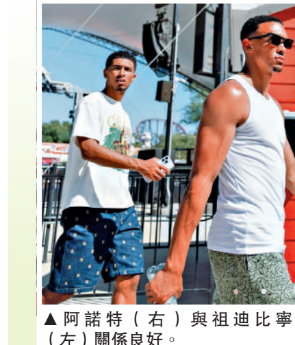
▲阿諾特（右）與祖迪比寧威（左）關係良好。