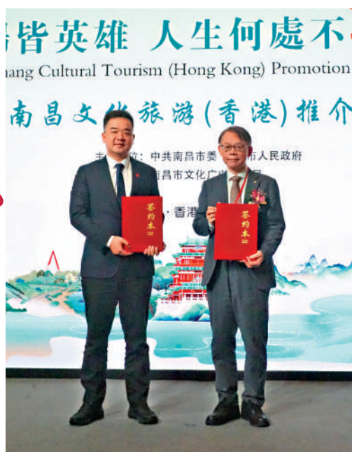
▲南昌市文化廣電旅遊局與香港教育工作者聯會交換合作協議。

出席推介會的主要嘉賓還包括：立法會議員楊永傑，中聯辦九龍工作部副部長郭長勇，南昌市文化廣電旅遊局黨組書記、局長萬利平等。