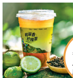
▲「鴨屎香」風味與鳳凰單叢茶頗有淵源。

如今，隨着茶飲文化的高速發展，年輕人鍾愛的「鴨屎香」風味與鳳凰單叢茶頗有淵源。「鴨屎香」是鳳凰單叢茶中的一種香型，因種在「鴨屎土」，茶葉形似鴨腳木而得名。謝鴻洲表示，用於製作奶茶的茶葉已經佔據鳳凰山茶產業六分之一。「自『鴨屎香』這個品牌得到關注以來，大家都來鳳凰山尋找『鴨屎香』這一品種。」