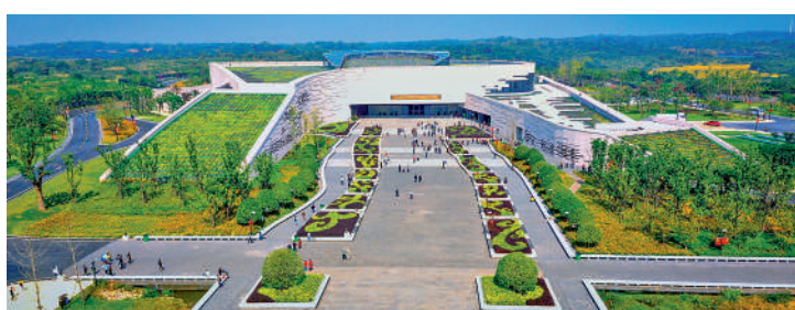
▲南昌漢代海昏侯國家考古遺址公園。

線路5 「出發南昌·周遊江西」 ●上饒 ●鷹潭 ●吉安 ●宜春 ●九江 ●景德鎮