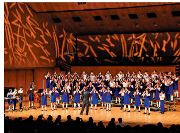
▲2024珠港澳合唱音樂會《我唱我歌》11月10日在港舉行。圖為香港兒童合唱團。