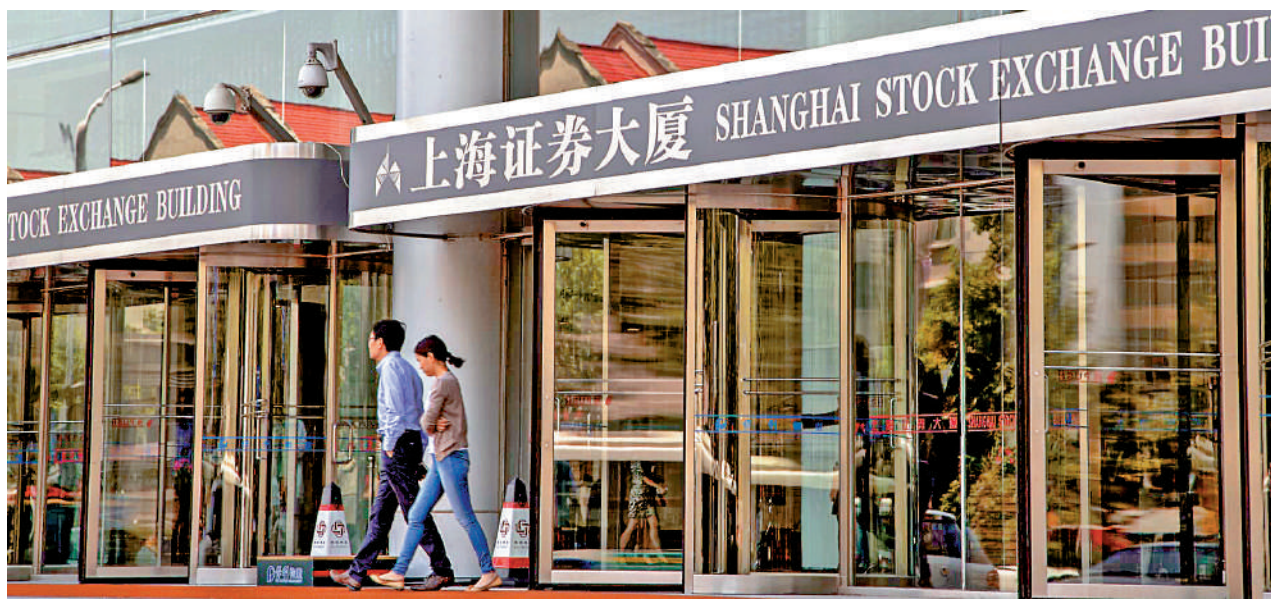
▲金融是國民經濟的血脈，是國家核心競爭力的重要組成部分，在科技創新產業化中起着至關重要的作用。