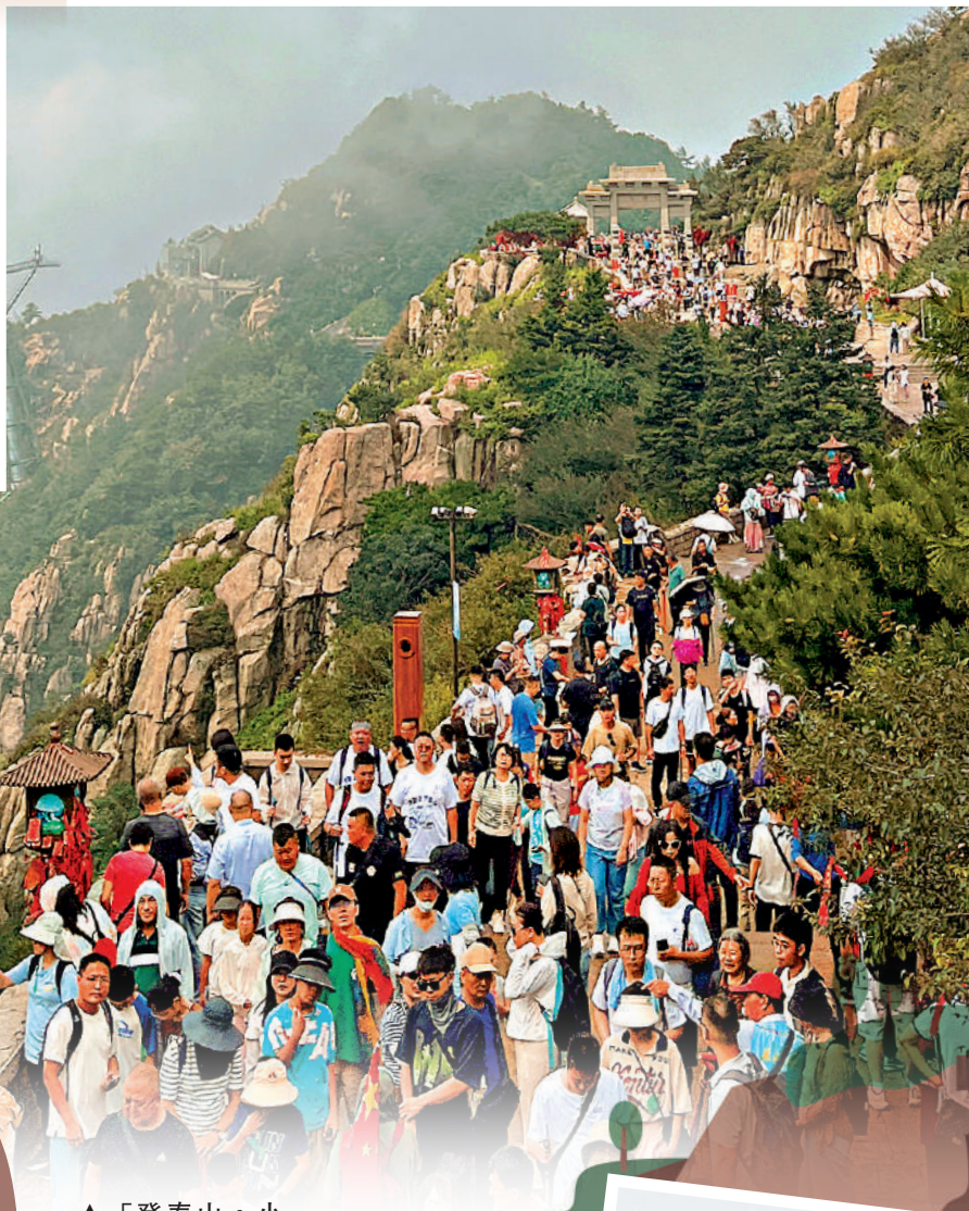
▲「登泰山，小天下」是很多遊客假期的首選計劃。