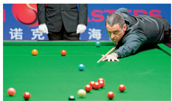
▲世界桌球名將奧蘇利雲。

2022年，香港桌球大師賽見證了世界一眾頂級選手齊聚一堂的盛況。英格蘭名將「火箭」奧蘇利雲於決賽中以局數6：4戰勝香港桌球「一哥」傅家俊，此戰香港體育館共聚集逾9000名觀眾，並打破世界紀錄。