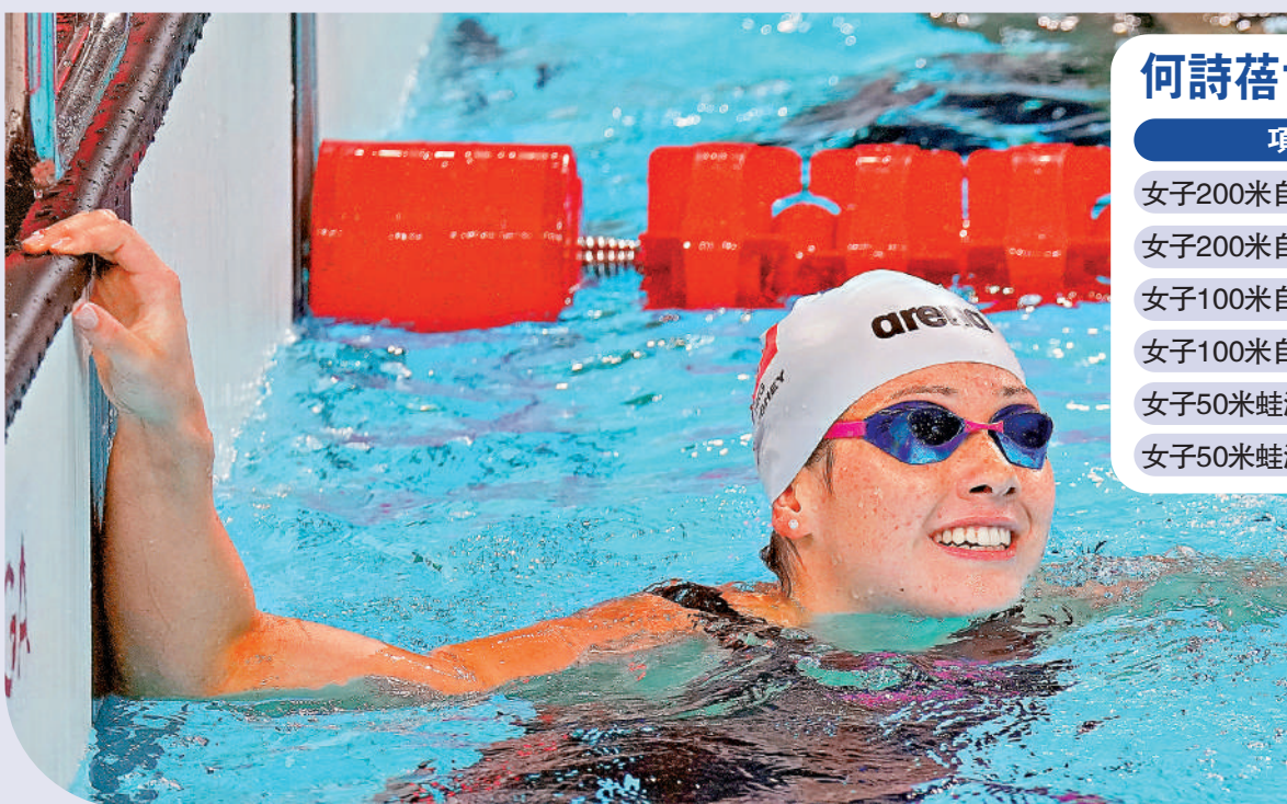
▲何詩蓓今力爭奧運後的首項錦標。