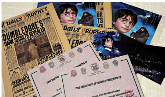
▲10月11日北京，哈利·波特英皇場觀影團為影迷贈送電影票根、霍格沃茨錄取通知書和預言家日報等周邊。