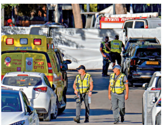
▲無人機襲擊內塔尼亞胡住宅後，以安全部隊封鎖附近區域。

以色列總理內塔尼亞胡辦公室19日稱，當天早上，一架從黎巴嫩方向發射的無人機襲擊了內塔尼亞胡位於以色列凱撒利亞地區的住所。事發時內塔尼亞胡夫婦不在家中，未造成人員傷亡。內塔尼亞胡隨後表示，沒有什麼能阻止他，以色列「將贏得這場戰爭」。隨着哈馬斯領導人辛瓦爾17日在以軍一次行動中身亡，中東衝突各方矢言繼續戰鬥，該地區局勢恐將持續惡化。