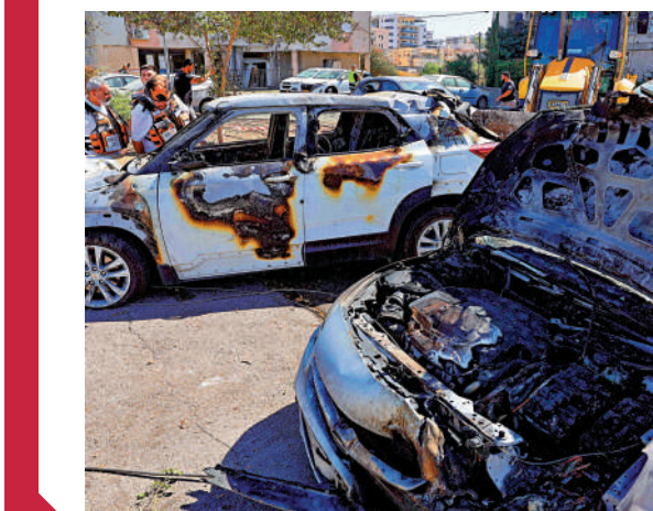
▲以色列境內多輛汽車被從黎巴嫩發射的火箭彈擊中。