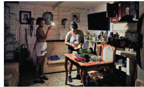
▲古巴大停電，一名婦女在手機燈光下準備食物。

原因是美國對古巴的經濟戰加劇以及金融和能源迫害愈演愈烈。白宮方面否認，稱「古巴的整體能源狀況不應歸咎於美國」。