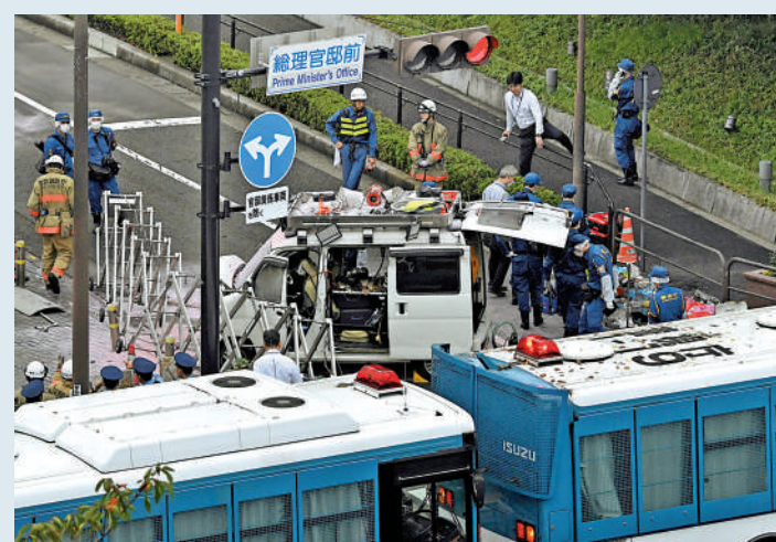
▲警察在首相官邸外的圍欄旁對涉事車輛進行調查。

日本眾議院大選10月15日發表公告，10月27日投票，各政黨重要人物在這段時間四處拉票，加上過去選舉期間曾發生政治人物遇襲事件，讓警方安保備受關注。