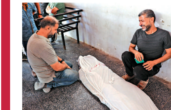
▲加沙死難者的親屬在遺體旁痛哭。