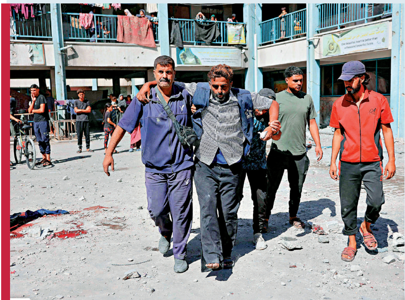
▲以軍19日空襲加沙北部難民營，多人傷亡。