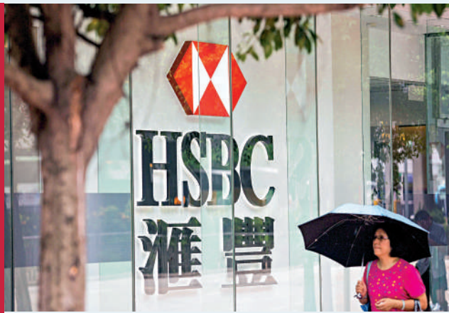
▲滙豐新架構提升了香港業務的自主性，減少重複的決策程序。