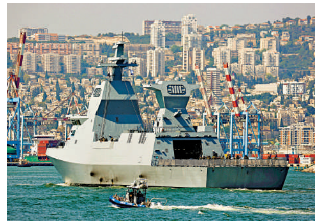
▲以色列指控「伊朗間諜」收集以方軍事情報。圖為以軍艦進入海法港口。資料圖片

本月1日伊朗對以色列發動大規模導彈襲擊以報復以方暗殺行動，以色列將如何回應受到各方關注。美國總統拜登18日稱，他知道以色列將如何回應。伊朗駐聯合國代表伊拉瓦尼21日致信聯合國，指出拜登的言論具煽動性，表明美國默許且支持以色列對伊朗的非法軍事侵犯。伊朗外長阿拉格齊22日說，所有鄰國都已向伊朗保障，不會允許美以兩國利用其領土和領空來針對伊朗。