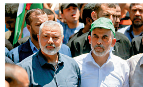
▲哈馬斯兩任領導人哈尼亞（左）和辛瓦爾均被以色列殺害。資料圖片

去年10月7日新一輪巴以衝突爆發後，以色列一直在追殺哈馬斯和黎巴嫩真主黨的高級官員。今年7月31日，時任哈馬斯政治局領導人哈尼亞在伊朗首都德黑蘭死於以軍襲擊。8月初，辛瓦爾接替哈尼亞，出任哈馬斯政治局領導人。本月16日，以軍在加沙南部城市拉法打死3名武裝人員，事後發現其中一人是辛瓦爾。此後，誰將接替辛瓦爾領導哈馬斯受到各方關注。