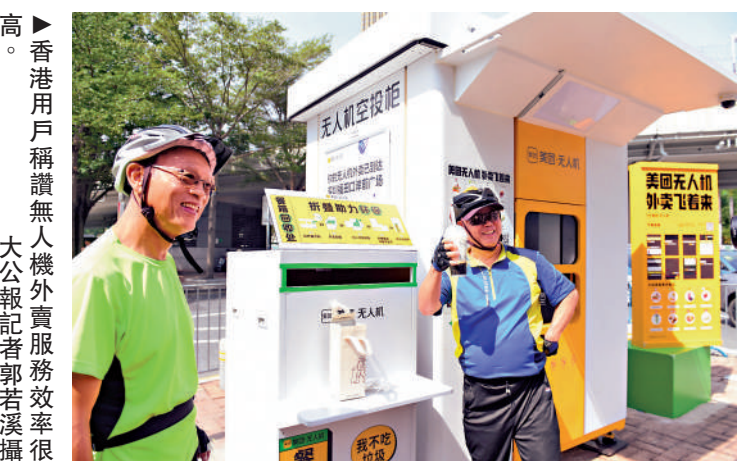
►香港用戶稱讚無人機外賣服務效率很高。

麻煩。有了無人機外賣，現在不再需要等待外賣員的步行配送，只需走到口岸旁邊指定的空投櫃取餐即可，不僅提高了效率，還節省了溝通時間。港人林先生表示，盼望香港能盡快有無人機外賣，他說，無人機配送的形式比較先進，希望香港也能慢慢普及，讓大家的更方便。