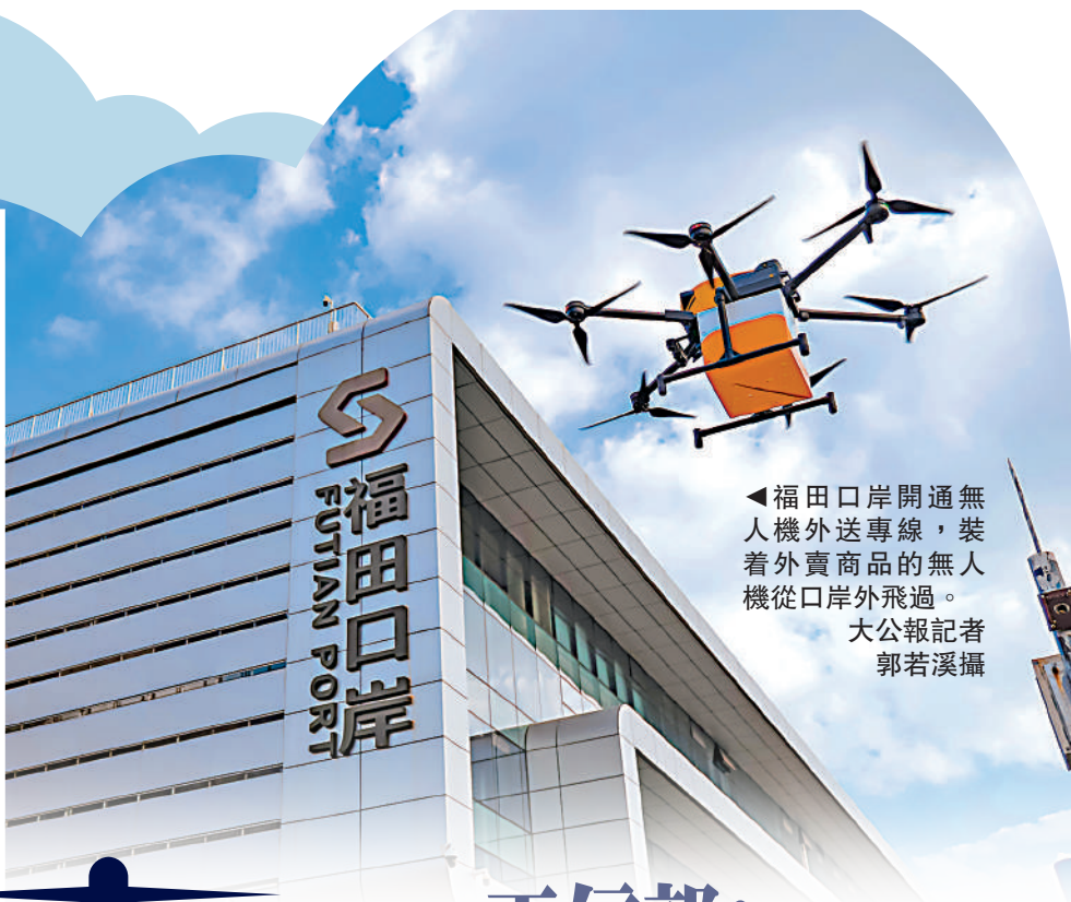
◀福田口岸開通無人機外賣專線，裝着外賣商品的無人機從口岸外飛過。

用美團外賣App或美團無人機小程序提前下單，到達福田口岸時即可前往智能空投櫃取走商品，實現「人來貨到」。下單時，港人還可通過微信港幣錢包支付，系統會自動將人民幣交易轉為港幣付款，無需手動換匯，享零手續費優惠。