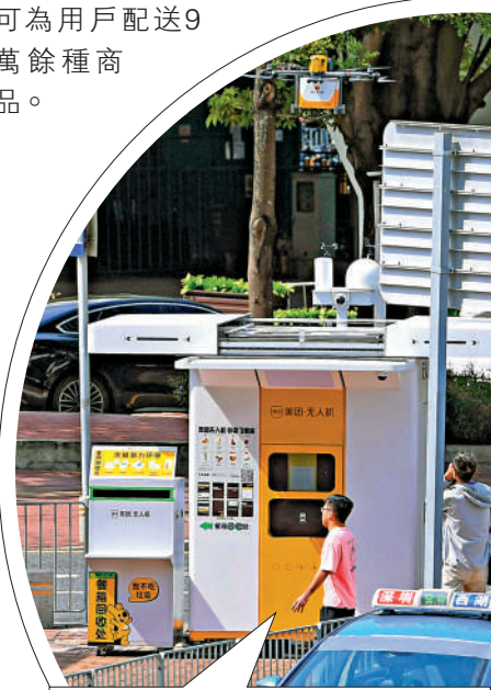
• 提交訂單，等待無人機接單，當訂單狀態顯示為「無人機已送達」時，在空投櫃輸入手機號末四位取貨

近年來，美團無人機也在持續加碼城市場景的應用落地，截至2024年9月底，美團無人機在深圳、北京、上海、廣州、南京等城市開通43條航線，並累計完成訂單超36萬單，可為用戶配送9萬餘種商品。