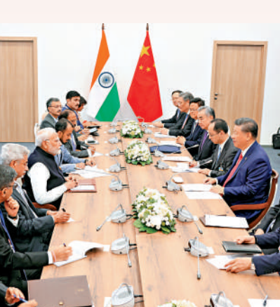
▲當地時間10月23日，習近平在金磚國家領導人會晤期間會見印度總理莫迪。

莫迪表示，印中關係保持穩定發展對兩國和兩國人民至關重要，事關28億人民的福祉和未來，對地區乃至世界和平與穩定也十分重要。在當前複雜國際形勢下，作為兩大古老文明和兩大經濟引擎，印中合作有利於促進經濟復甦和世界多極化。印方願同中方加強戰略溝