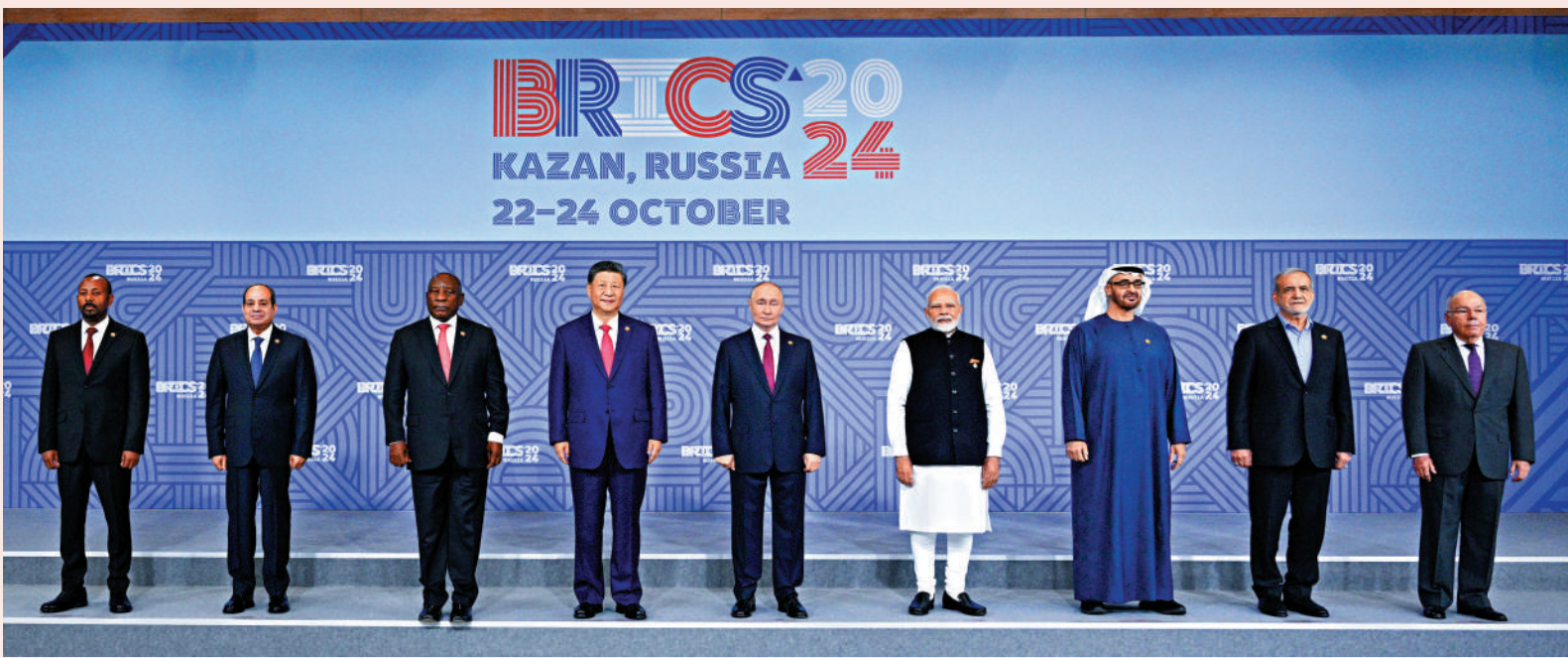
▲當地時間10月23日上午，金磚國家領導人第十六次會晤在喀山會展中心舉行。俄羅斯總統普京主持會晤。中國國家主席習近平、巴西總統盧拉（線上）、埃及總統塞西、埃塞俄比亞總理阿比、印度總理莫迪、伊朗總統佩澤希齊揚、南非總統拉馬福薩、阿聯酋總統穆罕默德等出席。這是會晤期間，金磚國家領導人集體合影。

當地時間10月23日上午，金磚國家領導人第十六次會晤在喀山會展中心舉行。俄羅斯總統普京主持會晤。中國國家主席習近平、巴西總統盧拉（線上）、埃及總統塞西、埃塞俄比亞總理阿比、印度總理莫迪、伊朗總統佩澤希齊揚、南非總統拉馬福薩、阿聯酋總統穆罕默德等出席。 習近平出席大範圍會議，就未來金磚發展發表重要意見，提出五點建議。習近平強調，我們要建設「公正金磚」，做全球治理體系改革的引領者。促進金融基礎設施互聯互通，維護高水平金融安全，做大做強新開發銀行，推動國際金融體系更好反映世界經濟格局變化。