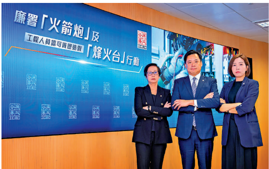
▲廉署拘捕一百四十八人，涉購買虛假工作經驗取得從事電工、操作挖泥機的专业資格。

【大公報訊】記者盛德文報道：廉政公署早前分別接獲考取挖泥機操作員專業資格認證，以及有人涉嫌以貪污手段申請「電工A牌」的投訴。經深入調查，署方本月先後採取分別代號「火箭炮」及「烽火台」的行動，拘捕111名建造業及37名電力工程相關人士共148人，他們涉嫌透過貪污舞弊及造假手段，以虛假工作證明文件騙取兩類工程專業資格認證，詐騙勞工處認可的挖泥機操作員專業證書，以及詐騙機電工程署發出的電業工程人員註冊證書。