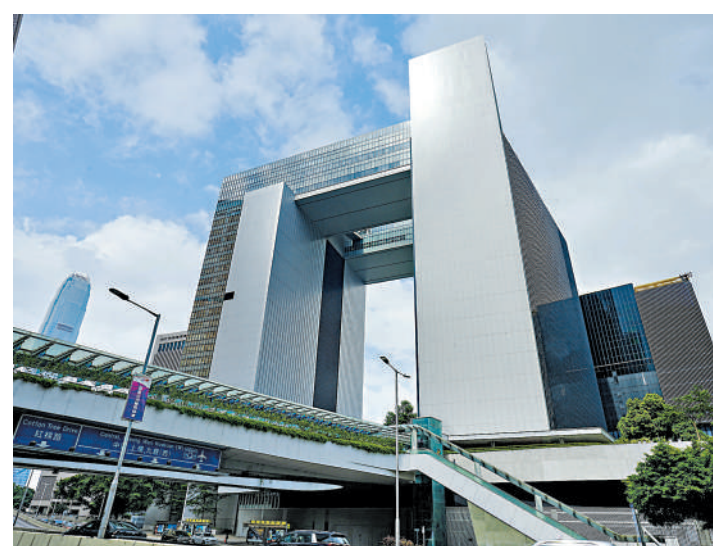
▲特區政府發言人表示，香港在「一國兩制」下保持着深受信賴的法律制度，而法治更是一直得到社會的廣泛認同和尊重。

發言人強調，香港的法律援助制度覆蓋全面、穩健、經費充足，這亦對維護法治起着舉足輕重的作用。除此之外，在基本法和香港人權法案條例的保障下，香港市民享有向法院提起訴訟及尋求司法補救的基本權利。