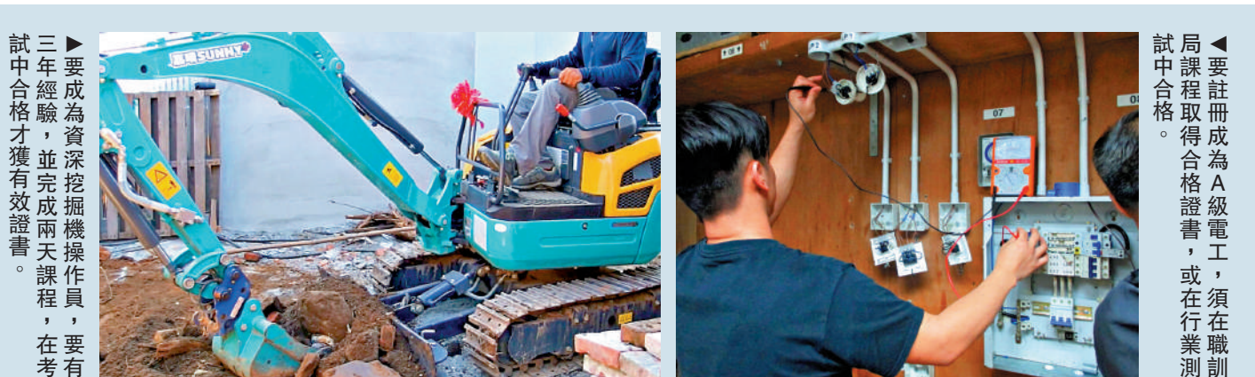
▶要成為資深挖泥機操作員，要有三年經驗，並完成兩天課程，在考試中合格才獲有效證書。

廉署表示，兩宗案件作案手法相似，但未發現兩案有關聯，調查仍在進行中，不排除會有進一步拘捕行動。現階段未發現有被捕人士在過往工作中導致工業意外，廉署亦和勞工處及機電署跟進，確保工程的安全性不會受影響。勞工處及機電署已就案件進行審視，並立即檢視所有懷疑有問題的專業證書或註冊申請，以及即時啟動吊銷相關人士專業資格的程序。