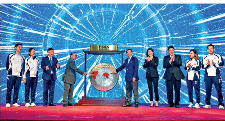
▲港交所昨舉行敲鑼儀式賀港隊巴黎奧運獲佳績。

【大公報訊】2024年巴黎奧運會中國香港代表團昨天於香港交易及結算所有限公司香港金融大廈出席收市敲鑼儀式，慶祝港隊運動員於巴黎奧運取得驕人成績。為進一步支持體育推廣工作，香港交易所慈善基金撥款一百萬港元，贊助中國香港體育協會暨奧林匹克委員會奧夢成真有限公司。