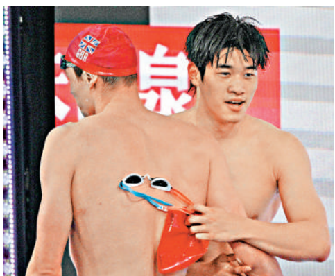
▶潘展樂（右）奪得男子400米自由泳金牌。