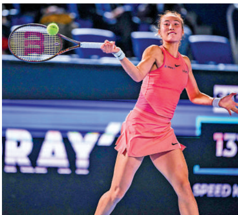
▲鄭欽文回擊來球。