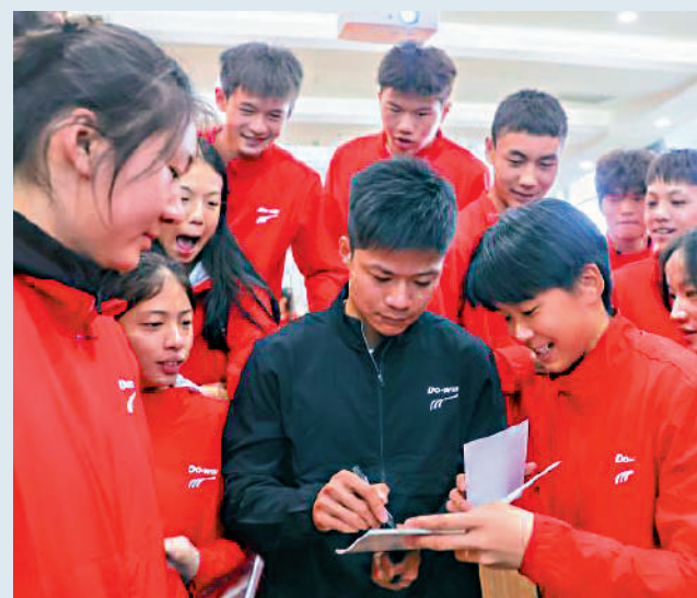
▲蘇炳添（前右二）為年輕運動員簽名。

他透露，自己正在積極恢復身體狀態，希望盡可能以運動員的身份參加明年在家門口舉辦的全運會，也許是參加接力賽。