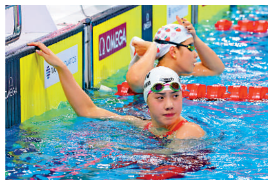
▲張雨霏（前）昨天繼續養傷。資料圖片

【大公報訊】記者梁潤森報道：國家游泳隊女子名將張雨霏原定在短池游泳世界盃仁川站首天出戰女子50米自由泳預賽，但她昨天於個人微博發文表示，很抱歉由於肩傷問題，無法正常運動及比賽，在上海站最後一天和仁川站的首天棄權了個別項目，後續比賽她會按照路線繼續前往，但還得視現場狀況而定，她最後表示感謝大家的支持。