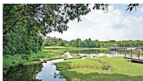
▲政府公布建立濕地保育公園系統策略可行性研究報告，指系統是可行且值得。

另外，環境及生態局局長謝展寰昨日在立法會環境事務委員會政策簡報會上表示，特區政府致力建設美麗香港，今年先後於三月及十一月設立紅花嶺郊野公園及北大嶼海岸公園，亦正推進面積比香港濕地公園大五倍的三寶樹濕地保育公園。「我們