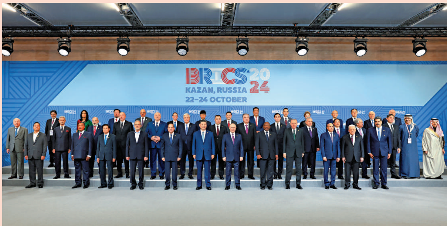
▲當地時間10月24日上午，國家主席習近平在喀山會展中心出席「金磚+」領導人對話會並發表題為《匯聚「全球南方」磅礴力量 共同推動構建人類命運共同體》的重要講話。圖為出席對話會的金磚國家及嘉賓國領導人或代表、國際組織負責人集體合影。

當地時間10月24日上午，國家主席習近平在喀山會展中心出席「金磚+」領導人對話會並發表題為《匯聚「全球南方」磅礴力量 共同推動構建人類命運共同體》的重要講話。習近平提出，重振發展，實現普遍繁榮，並強調無論國際形勢如何變化，中國始終心繫「全球南方」、扎根「全球南方」，支持更多「全球南方」國家以正式成員、夥伴國、「金磚+」等形式加入金磚事業，匯聚「全球南方」磅礴力量，共同推動構建人類命運共同體。10月24日午夜，習近平結束出席金磚國家領導人第十六次會晤後乘專機回到北京。