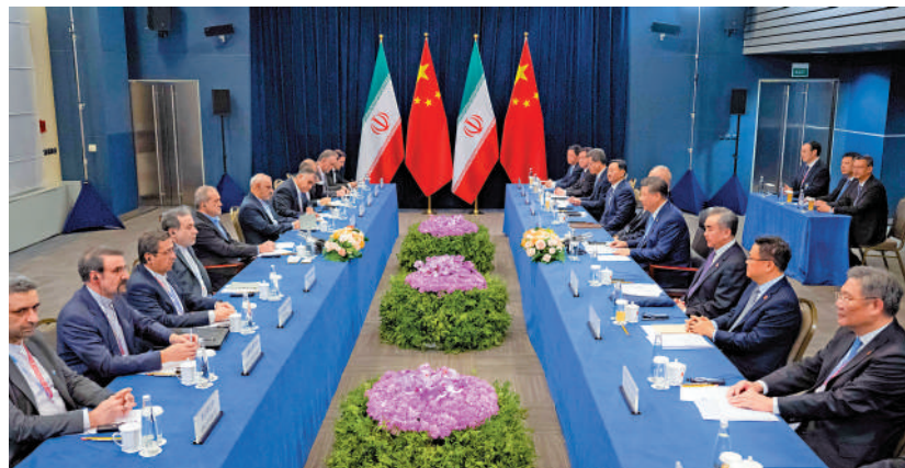
▲當地時間10月23日下午，習近平在喀山出席金磚國家領導人會晤期間會見伊朗總統佩澤希齊揚。

佩澤希齊揚表示，中國是伊朗最重要的合作夥伴，伊中全面戰略夥伴關係及各領域合作保持良好發展勢頭。伊方希同中方共同努力，落實好兩國全面合作計劃，推動兩國在互聯互通、基礎設施、清潔能源等領域深化合作，取得更多成果，這不僅將助力伊朗國家發展，也有助於促進地區和平與穩定。伊方願同中方繼續在涉及彼此核心利益問題上堅定相互支持，共同反對霸權霸凌。感謝中方支持伊朗正式加入金磚合作機制，期待同中方在金磚國家等多邊平台密切協作。雙方還就當前中東地區形勢交換意見。習近平指出，中方對當前中東地區局勢深感憂慮。盡早實現加沙停火止戰，是緩和地區局勢緊張的關鍵。國際社會應該形成合力，敦促有關各方切實履行聯合國安理會決議，避免地區局勢進一步動盪。