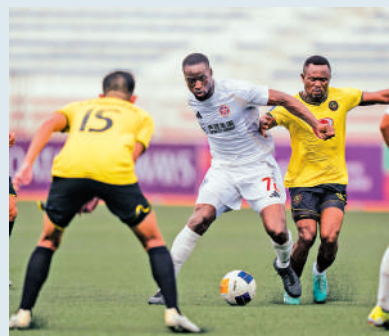
▲東方（白衫）表現予人驚喜。