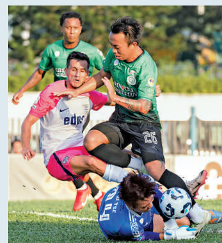
▲大埔（綠衫）上周港超主場1球小勝傑志（白衫）。

另外，本周日還有兩場銀牌組8強賽事，分別為下午3時，理文在大埔運動場門北區，以及晚上6時30分，東方於青衣運動場對陣南區。