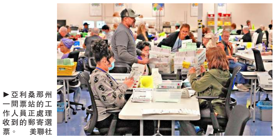
▲亞利桑那州一票站的工作人員正處理收到的郵寄選票。