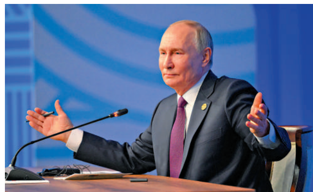
▲俄羅斯總統普京24日出席喀山金磚峰會記者會。

朝鮮外務省負責俄羅斯事務的副相金正奎25日表示，注意到近期國際輿論有「朝鮮向俄羅斯派兵」的說法，朝鮮外務省不直接干預國防省的行為，如果存在國際輿論所描述的事情，那也是符合國際法律規範的行動。韓國國情院上周宣布，朝鮮已決定向俄羅斯派出4個旅團規模的特戰部隊士兵參戰，規模為12000人。烏克蘭總統澤連斯基25日稱，俄羅斯最快可能在27日派遣朝鮮部隊加入作戰。