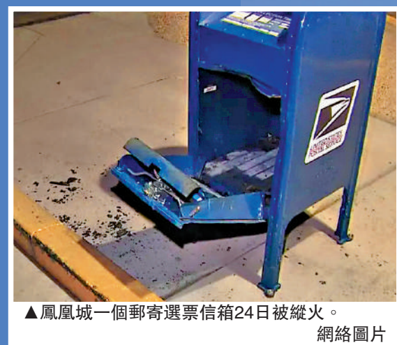
▲鳳凰城一個郵寄選票信箱24日被縱火。