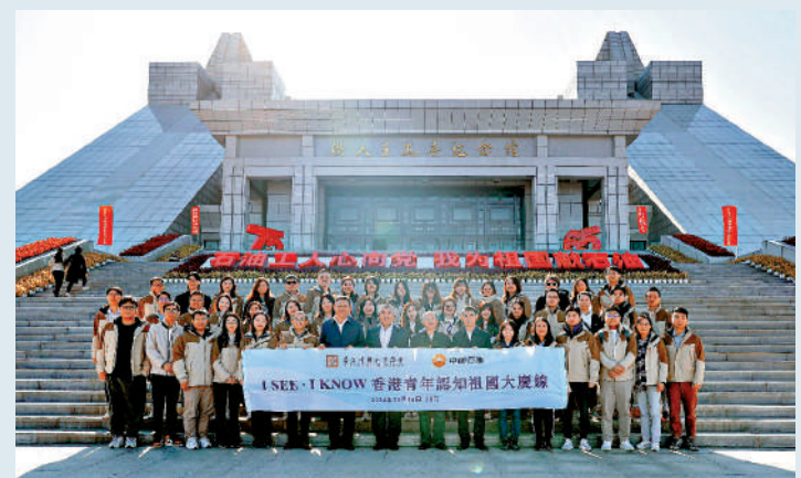
▲五十名香港青年認識到大慶油田對國家的貢獻。

參訪團隨後行程還前往哈爾濱市，了解和銘記東北抗戰歷史，探尋體驗哈爾濱歷史文化。大家感受到大自然的神奇力量，領略了祖國山河之美、文化之韻，表達了對祖國大好河山的熱愛之情。