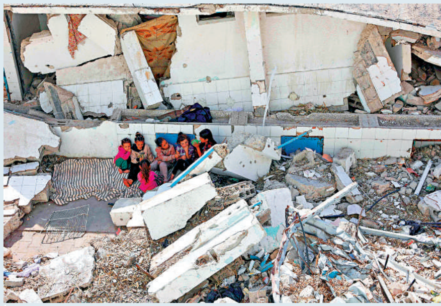
▲以軍持續轟炸加沙。圖為流離失所的巴勒斯坦兒童。

敘利亞 敘利亞譴責以色列26日對伊朗的襲擊。敘利亞與伊朗「團結一致」，支持伊朗自衛、保護領土和公民生命的合法權利。 大公報整理