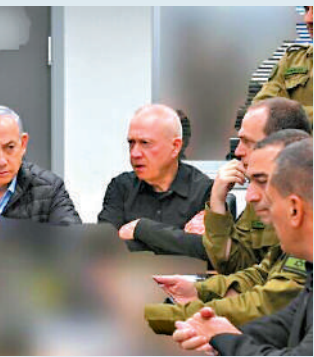
▼在對伊朗襲擊期間，以色列總理內塔尼亞胡（中）和軍方高層在國防軍總部內。