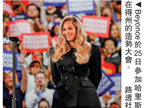
▲Beyonce於25日參加哈里斯在得州的造勢大會。

休斯敦是Beyonce的故鄉。她當天現身造勢活動，對全場3萬名觀眾稱，「現在是美國唱響新歌的時候」。她強調，自己不是以名人或政治人物身份出