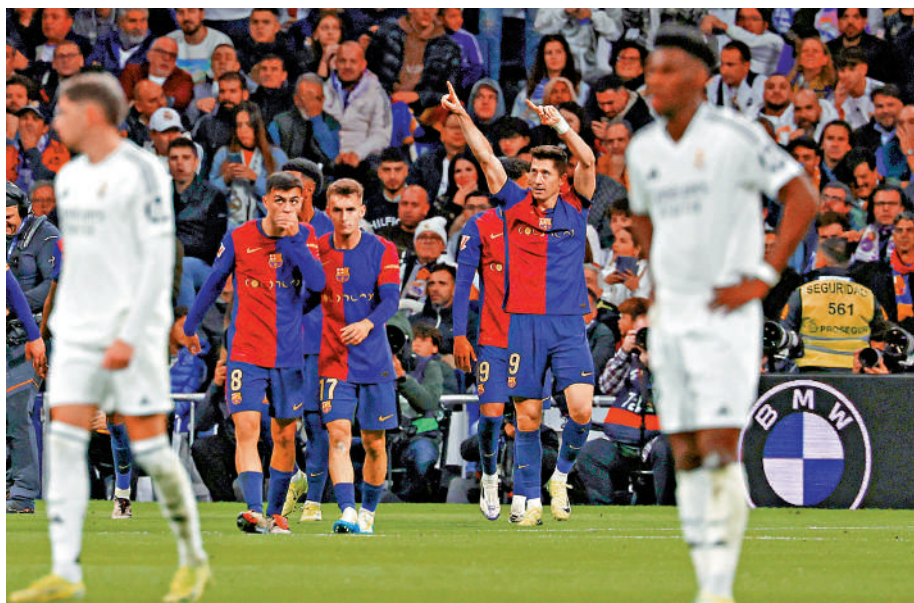
▲巴塞隆納(紅藍衫)作客4:0大勝皇馬。

【大公報訊】巴塞隆納主帥費力克在自己首場領軍的「國家打吡」，施展冒險的高位防守「越位戰術」，結果高風險得到高回報，全場讓主場的皇家馬德里12次跌入越位陷阱，而自己把握4次機會，於昨晨西甲作客大勝4:0。