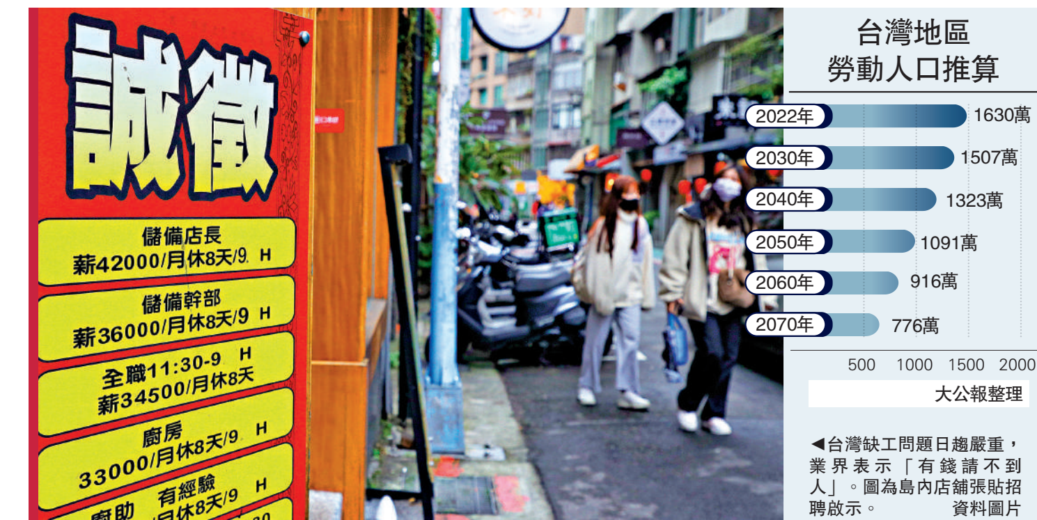
▲台灣缺工問題日趨嚴重，業界表示「有錢請不到人」。圖為島內店鋪張貼招聘告示。資料圖片

台灣半導體企業林姓負責人表示，島內未來總人口持續下降，明年將邁入超高齡社會，台灣「少子化」「高齡化」現象將更趨明顯。台灣未來可能無可用之工，更無可用之兵。而民進黨當局對此束手無策，只想著搞「台獨」，完全漠視台灣產業發展與民眾福祉。