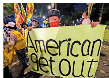
▲台灣民眾舉行集會，批評美國政府插手台灣問題破壞台海和平。資料圖片

【大公報訊】據中通社報導：美國共和黨總統候選人特朗普近日接受全美最熱門播客節目《喬·羅根體驗》採訪時再次提及，台灣若需要美國保護，就應該支付「保護費」。