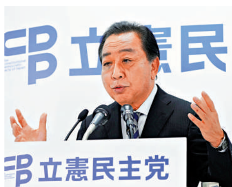
▲最大在野黨立憲民主黨黨首野田佳彥有意爭奪首相大位。

日本第50屆眾議院選舉結果於28日凌晨揭曉。受黑金醜聞和經濟議題等因素影響，自民黨慘敗，與公明黨結成的執政聯盟所獲議席自2009年以來首次未過半數。自民黨總裁、出任首相不足一月的石破茂28日表示將繼續執政，但暫未有吸納在野黨加入執政聯盟的設想，勢必成為「跛腳鴨」。石破茂接下來將面臨多重挑戰，11月11日的日本特別國會將舉行首相指名選舉；明年日本參議院選舉前，自民黨或為選情與其割席。