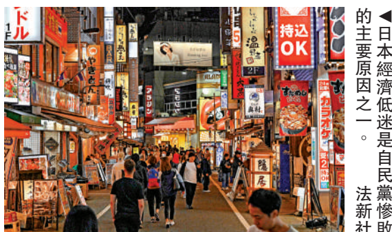
▲日本經濟低迷是自民黨慘敗的主要原因之一。

有分析人士認為，如果石破茂無法找到聯合執政的盟友，20世紀90年代多個在野黨聯合起來推翻自民黨政權的情景可能再次上演。不過，目前日本的在野黨並不團結。在野黨與無黨派議員加在一起只有250個議席，要形成議席過半數的政治聯盟至少需要日本維新會和國民民主黨這兩個擁有較多議席的政黨同時加入。而日本維新會幹事長藤田文武28日明確表示，該黨不會主動提出加入執政聯盟，且因與最大在野黨立憲民主黨政策理念不合也難以