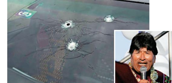
▲玻利維亞前總統莫拉萊斯險遭「暗殺」，他乘坐車輛的車身和擋風玻璃上有多個彈孔。

莫拉萊斯於2006年至2019年連續擔任三屆總統。在2019年10月舉行的大選中，莫拉萊斯因陷入選舉舞弊風波而被迫辭職，並先後輾轉多國尋求政治庇護。2020年10月，阿爾塞當選總統，同年11月，莫拉萊斯回國，試圖在政壇东山再起。