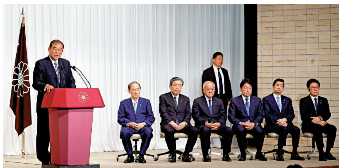
▲日本首相石破茂（左一）和自民黨高層28日見記者。