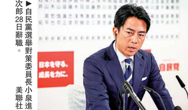
▲自民黨選舉對策委員長小泉進次郎28日辭職。

【大公報訊】日本第50屆眾議院選舉27日開始投票，共有1344名候選人參與爭奪眾議院465個議席。最終選舉結果顯示，自民黨所獲議席由選前247席降至191席，打破自2012年以來自民黨持續保持單獨過半數席位的昔日輝煌；加上公明黨的24個議席，執政聯盟席位由選前的279席降至215席，距離過半數還有18席之差。