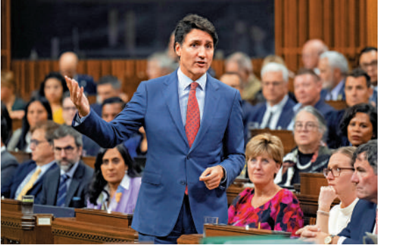
▲加拿大總理特魯多被黨友「逼宮」。

為提振支持率，加政府近來出多項限制移民的政策，24日宣布大幅削減移民人數計劃，明年加拿大永久居民人數目標將從原來的接納50萬減少到39.5萬；2026年、2027年將分別繼續降低到38萬和36.5萬。