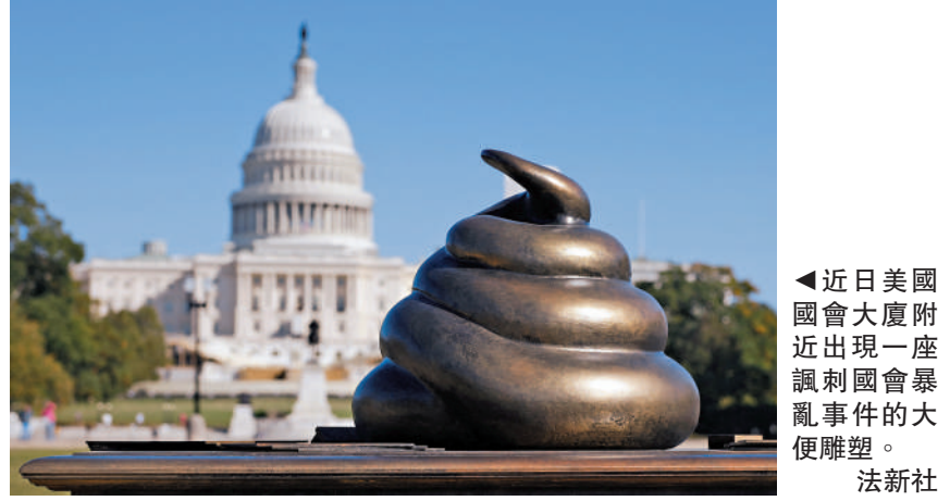
◀近日美國國會大廈附近出現一座諷刺國會暴亂事件的大便雕塑。法新社

眾對最高法院的信任。如果今年大選再出現法律問題，只有20%的受訪者相信最高法院能保持公正。在特朗普支持者中，34%對最高法院有信心；在哈里斯支持者中，只有6%表示有信心。（美聯社）