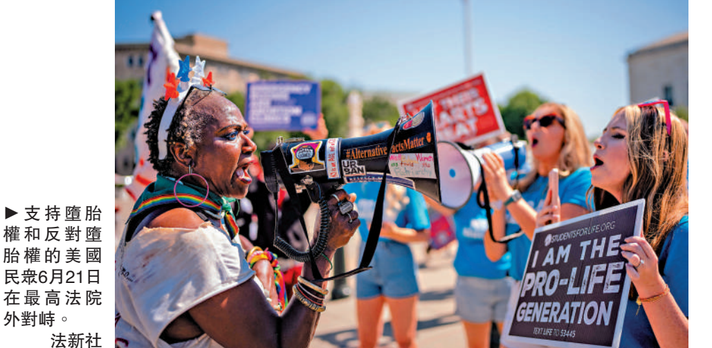
▶支持墮胎權和反對墮胎權的美國民眾6月21日在最高法院外對峙。法新社

在關鍵搖擺州密歇根為哈里斯站台，特別強調特朗普領導的政府將影響女性墮胎權益，而哈里斯將保護女性權益。特朗普本月早些時候在霍士新聞一個主要面向女性觀眾的節目上自稱「試管嬰兒（IVF）之父」，並聲稱共和黨比民主黨更支持體外受精，試圖以此爭取女性選民支持。哈里斯立即批評特朗普此番言論「怪異」。美媒指出，共和黨掌權的亞拉巴馬州今年裁定體外受精的胚胎屬於嬰兒，損壞胚胎者可能面臨刑事訴訟，導致該州醫療機構不敢提供IVF服務。特朗普的競選團隊事後解釋說，特朗普自稱「試管嬰兒之父」只是在開玩笑。（法新社）