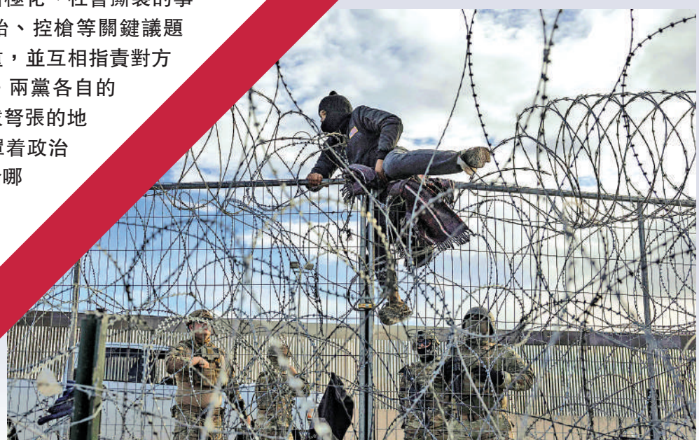
▲一名非法移民今年4月在美墨邊境試圖翻越鐵絲網進入得州。

美國大選進入最後衝刺階段，共和黨總統候選人特朗普和民主黨候選人哈里斯在各自積極造勢拉票的同時，也加大了相互攻擊的火力，凸顯美國政治極化、社會撕裂的事實。在移民、墮胎、控槍等關鍵議題上，雙方分歧嚴重，並互相指責對方是對國家的威脅。兩黨各自的支持者亦到了劍拔弩張的地步，美國社會籠罩着政治暴力的陰霾。無論哪一方在選戰中勝出，美國都將變得更加撕裂。