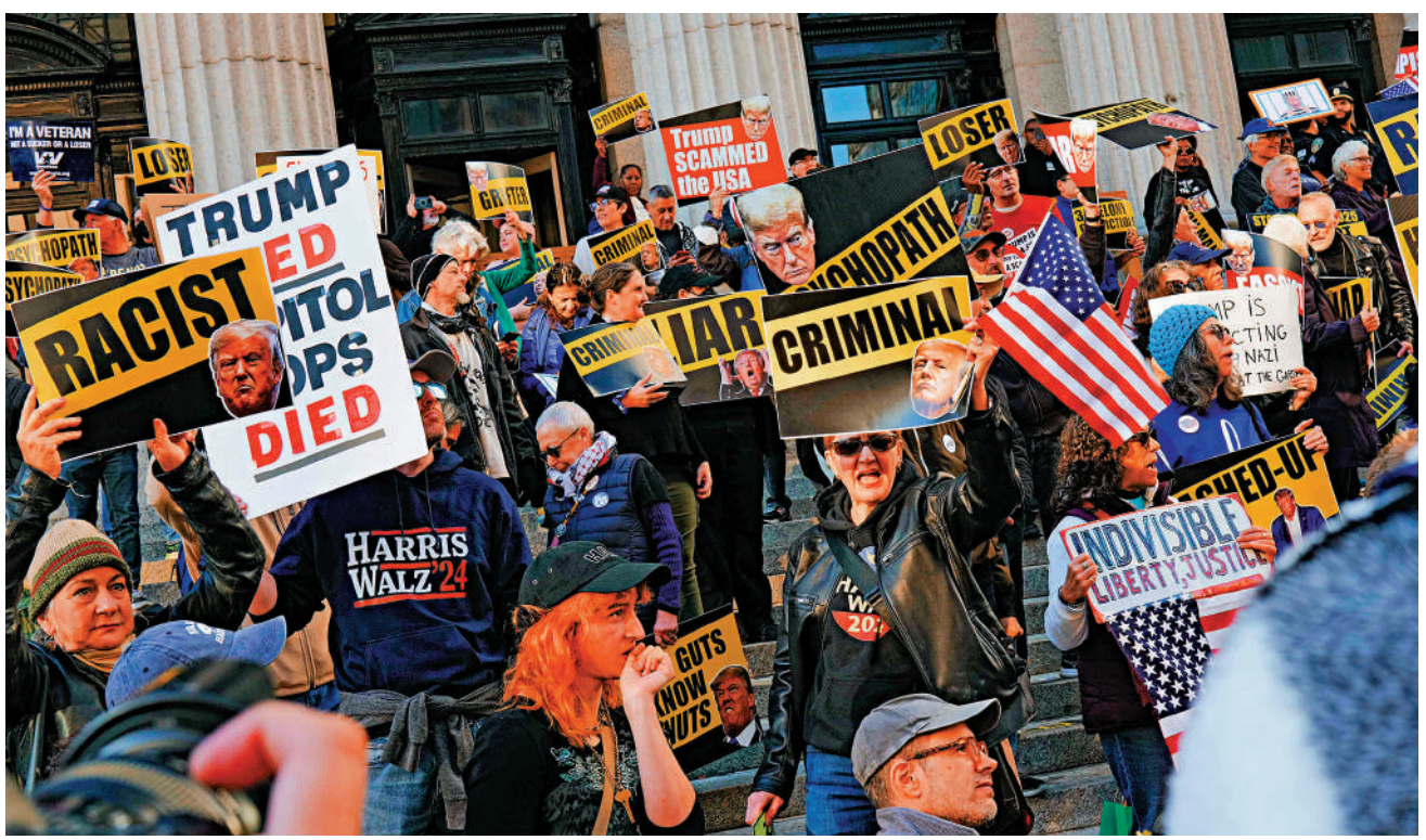
▲特朗普27日在紐約造勢，特朗普的反對者在活動現場附近抗議。