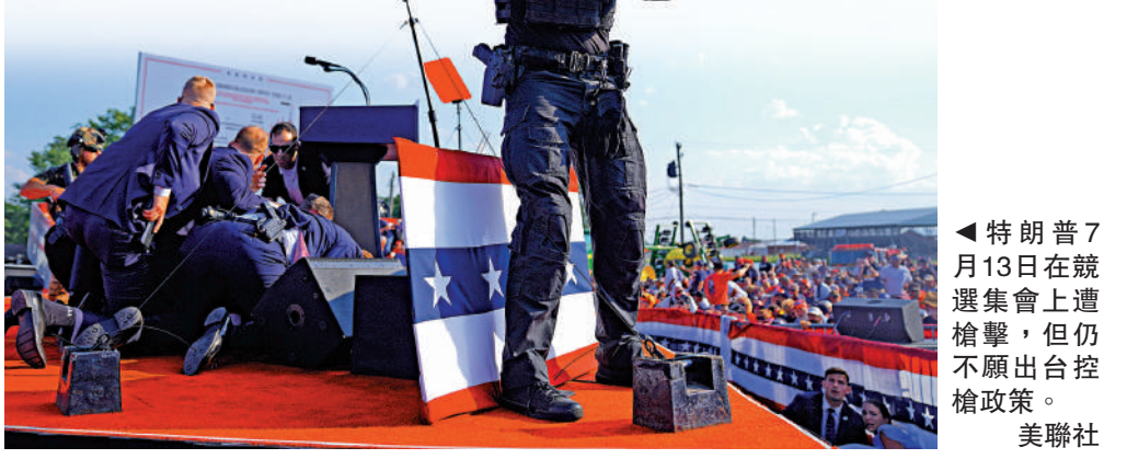
▶特朗普7月13日在競選集會上遭槍擊，但仍不願出台控槍政策。

她將延續拜登的控槍政策，並呼籲恢復聯邦攻擊性武器禁令，以及對槍支購買的例行背景調查。但批評者指出，拜登政府的控槍法案力度不夠，只是用來爭取選票的政治工具。7月，特朗普在賓夕法尼亞州集會上遭槍擊，右耳受傷。但在競選過程中，特朗普及其搭檔萬斯選擇淡化槍支暴力，依舊反對大多數控槍措施。特朗普甚至表示，若他在11月大選中勝出，將取消拜登政府的控槍措施。美國全國步槍協會（NRA）已公開表態支持特朗普。（衛報）