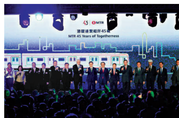
▲行政長官李家超出席港鐵舉行慶祝成立45周年酒會時表示，港鐵現時是世界上頂級的交通系統之一，期望港鐵能在未來更進一步。

李家超表示，特區政府亦全力推展三個智慧綠色集體運輸系統項目，並壓縮推展時間，已於今年8月就東九龍及啟德的項目邀請供應商及營運商遞交意向書。同時，特區政府也正全力推動港深西部鐵路的規劃，預計工程完成後，香港的鐵路網絡將從現時大約270公里增加到近390公里，他形容長遠的利潤和效益巨大。