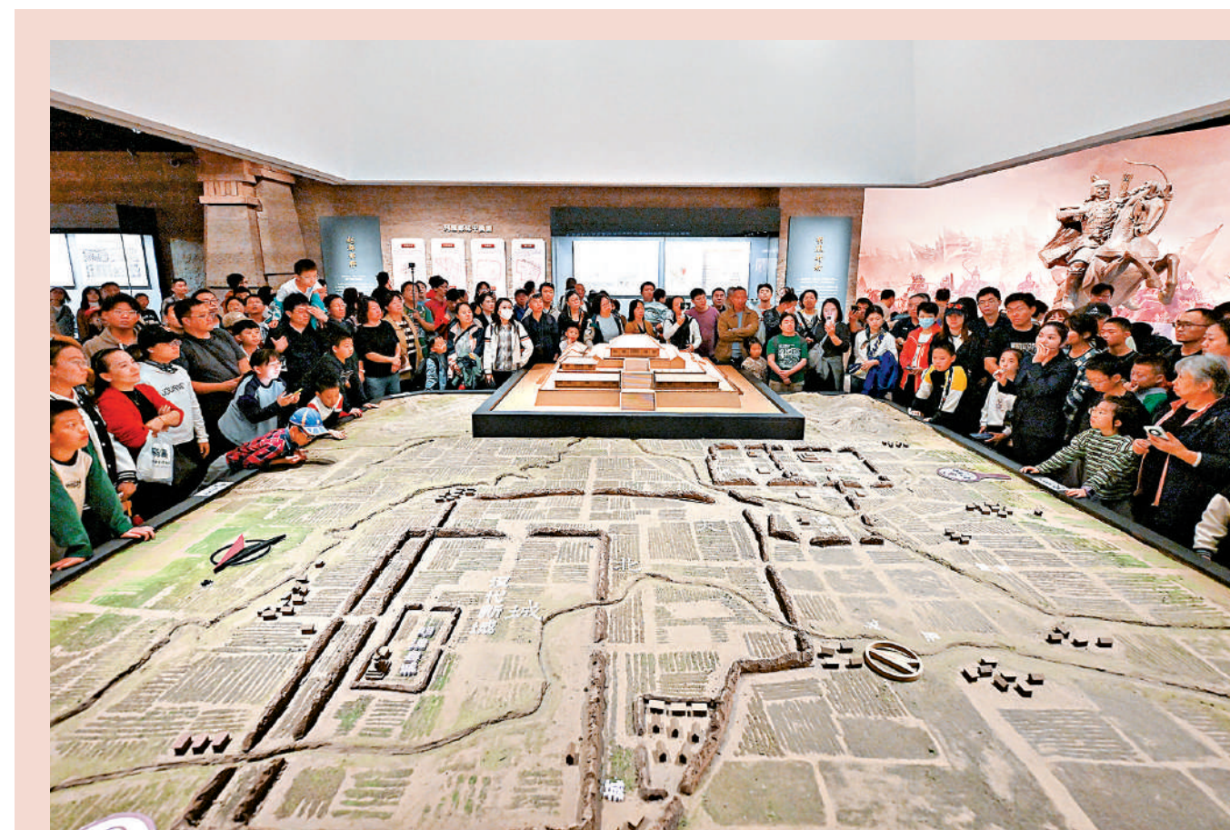
▲10月5日，遊客在河北省邯鄲市博物館觀看趙都邯鄲王城復原沙盤。

化創新創造活力。堅持以人民為中心的創作導向，堅持把社會效益放在首位、社會效益與經濟效益相統一，把激發創新創造活力作為深化文化體制機制改革的中心環節，加快完善文化管理體制和生產經營機制。圍繞提高文化原創能力，改進文藝創作生產服務、引導、組織工作機制，孕育催生一批深入人心的時代經典，構築中華文化的新高峰。積極營造良好文化生態，充分發揚學術民主、文藝民主，支持作家、藝術家和專家學者扎根生活、潛心創作，推動文化創新創造活力持續迸發。探索文化和科技融合的有效機制，實現文化建設數字化賦能、信息化轉型，把文化資源優勢轉化為文化發展優勢。