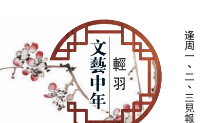
文藝中年 輕羽 逢周一、二、三見報

和節奏。是次演出同樣設置現場樂隊，但是西洋鼓和電結他的聲效並不突出，令全劇的搖滾味道並不熾烈。另外，科技效果令全劇的宏偉質感提升，但是男主角如何一步一步墮入深淵，角色的設計仍可細緻鋪排。