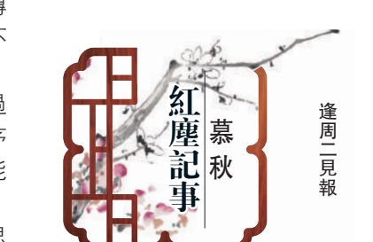
紅塵記事 慕秋 逢周一見報