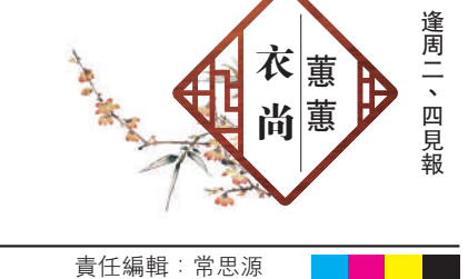
衣尚 蕙蕙 逢周二、四見報

今個冬日外套，仍以短身設計為主流，內裏的襯衣可齊腳或稍長，外套袋子減少單調感，還有着重腰帶設計的皮褸，是塑造另一派時尚形象的外套款。背心的設計，是很受歡迎的冬裝；還有拉鏈與衫腳打摺和強調袋口，都是創新的冬日主流設計，也是本地的流行趨勢。