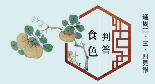
食色判答 杜若 逢周二、三、四見報

確實，人要到成年，才懂包子的好。看起來樸實無華，實則暗藏機關，裏面多少文章，全看你想怎麼讀。