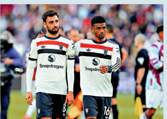
曼聯輸波後，球員表現失落。美聯社