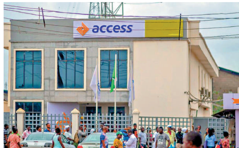
▲ Access Bank Plc是The Access Bank UK的母公司。

The Access Bank UK Limited是尼日利亞上市公司Access Bank Plc的全資附屬公司。Access Bank Plc董事總經理兼行政總裁Roosevelt Ogbonna昨日在香港表示，集團選擇在香港開設分行，主要因為香港是繼紐約、倫敦以外，另外一個全球重要的金融中心。他透露，The Access Bank UK Limited目前擁有8億美元資本，考慮到香港分行是有限牌照銀行，故其資本要求可計入The Access Bank UK Limited中，可以為香港分行提供強大的資金支持。