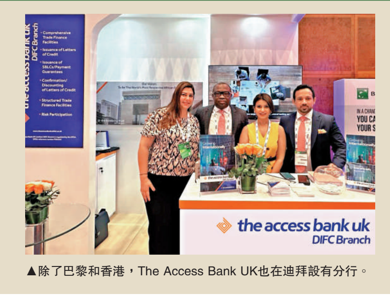
▲除了巴黎和香港，The Access Bank UK也在迪拜設有分行。

據介紹，這次來港開設香港分行的The Access Bank UK Limited，屬Access Bank Plc的全資附屬公司，並分別獲得英國審慎監管局（PRA）的授權，並受金融市場行為監管局（FCA）和PRA共同監管。此外，該行亦獲迪拜金融服務管理局（DFSA）授權，在迪拜國際金融中心運營業務；以及在巴黎設有分行，受法國監管局（ACPR）監管。