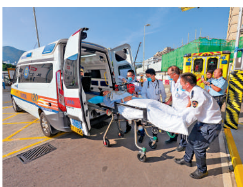
香港特區政府聯同廣東省和深圳市政府昨日進行第二次「大灣區跨境直通救護車試行計劃」演練。圖為演練中模擬載送病人的跨境救護車抵達屯門醫院的情況。

2023年施政報告提出探討粵港澳大灣區救護車跨境運送病人安排，試行計劃將先實行直通救護車由深圳和澳門的指定醫院載送病人到香港指定公立醫院的安排。香港特區政府表示，啟動跨境救護車機制的首要條件是確保派送醫院和接收醫院事先達成協議，以病人的醫療需要、安全和利益作首要考慮，同時設有防止濫用機制。