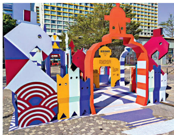
▲《遊走迷壺間》於香港藝術館前方的藝術廣場展出。

《遊走迷壺間》戶外藝術裝置將在藝術廣場展出至今年年底。前往香港藝術館的觀眾不妨在參觀鼻煙壺捐贈展的同時，一併體驗這個藝術裝置，感受歷史文物與當代藝術的溝通對話。