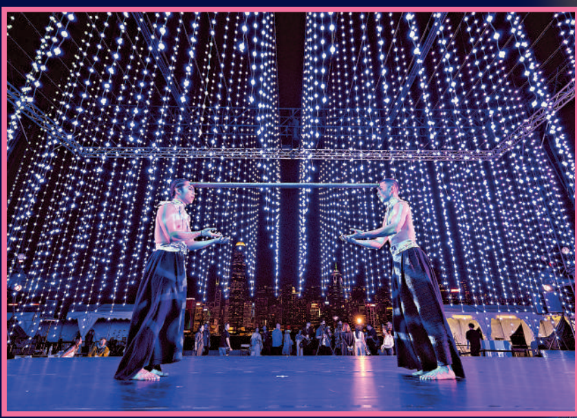
▲香港舞蹈團駐團舞者現場演繹。