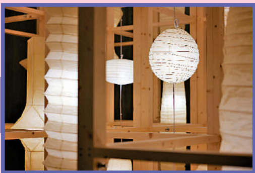
▲「傳丹創意現場：野口勇的「光」」是重新打造M+潛空間的長期項目。