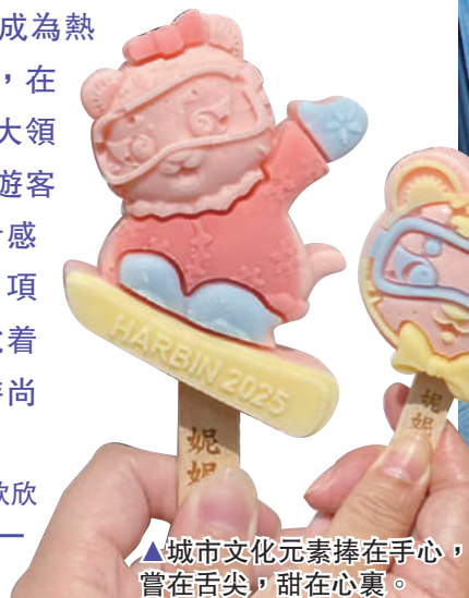
▲城市文化元素捧在手心，嘗在舌尖，甜在心裏。