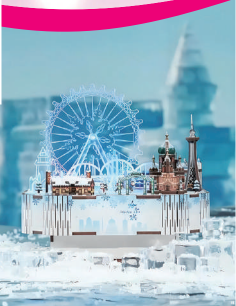
▲設計精美的冰雪文創品，讓遊客把童話世界帶回家。