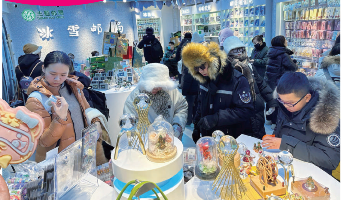
▲冰雪文旅為媒，「爾濱」新增各類文創店超千家，創意產品受到遊客熱捧。