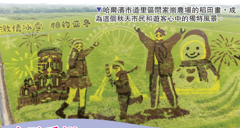
▼哈爾濱市道里區閭家崗農場的稻田畫，成為這個秋天市民和遊客心中的獨特風景。

而作為哈爾濱文旅融合的新地標——松雷何所有城市會客廳吸引大量市民和遊客沉浸式體驗並為之點讚。