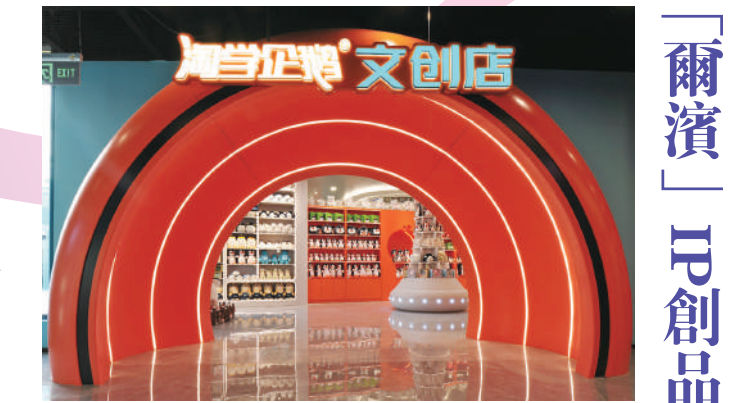
▲全國首家冰雪文旅集合店「淘學企鵝文創店」已經開發出200餘種文創衍生品。

未來，哈爾濱將加快形成品類齊全、競爭有力、影響廣泛的創意設計產業集群，增強創意設計產業的全國競爭力；同時從綠色食品、特色文旅、老字號和原字號企業，以及歷史街區、工業遺存等對象中優選特色載體，有效導入創意設計賦能價值，促進實體經濟轉型升級。