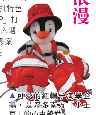
▲可愛的紅帽子淘學企鵝，是眾多南方「小土豆」的心中摯愛。

餘次專項創意設計賦能行動，有效助力全市美麗鄉村、城市更新和產業發展。提煉推廣何所有、喬府大院、森鷹木門等6個創意設計賦能經典案例，哈爾濱電機廠、航天雲網等企業入選龍江工業設計十大典型案例。通過創意設計賦能，房車小鎮、套娃小鎮、帽兒山旅遊小鎮、得莫利旅遊小鎮等生態旅遊景區得到有效提升。改造升級20餘條創意設計街區，賦能引領重點文旅景區轉型升級，哈藥集團製藥六廠舊址、哈爾濱冰雪文化博物館等一批特色網紅打卡地出圈出彩。以「城市IP」打造創意設計新引擎，「淘學企鵝」入選2022年度國家旅遊宣傳推廣優秀案例，「雪妮妮」城市品牌IP形象亮相「哈洽會」，有效釋放創意設計賦能推力。移動的「清明上河圖」、「動力星野」等一批創意設計應用場景拓展了文旅消費新領域，讓老城區煥發新活力。