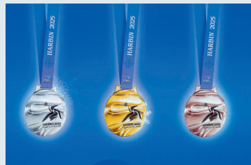
▲亞冬會獎牌「競速精神」的正面。

第9屆亞冬會是繼北京冬奧會後我國舉辦的又一重大綜合性國際冰雪運動盛會，也是自1996年後哈爾濱第2次承辦亞冬會。賽會將於2025年2月7日開幕。