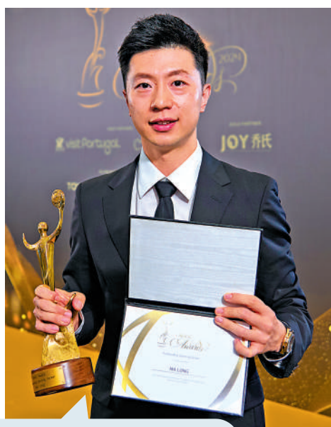
▲馬龍在頒獎禮後拍照留念。

「對於乒乓球的熱愛，我們團隊的支持，還有我家人的支持，幫助我走到了今天。」馬龍說。