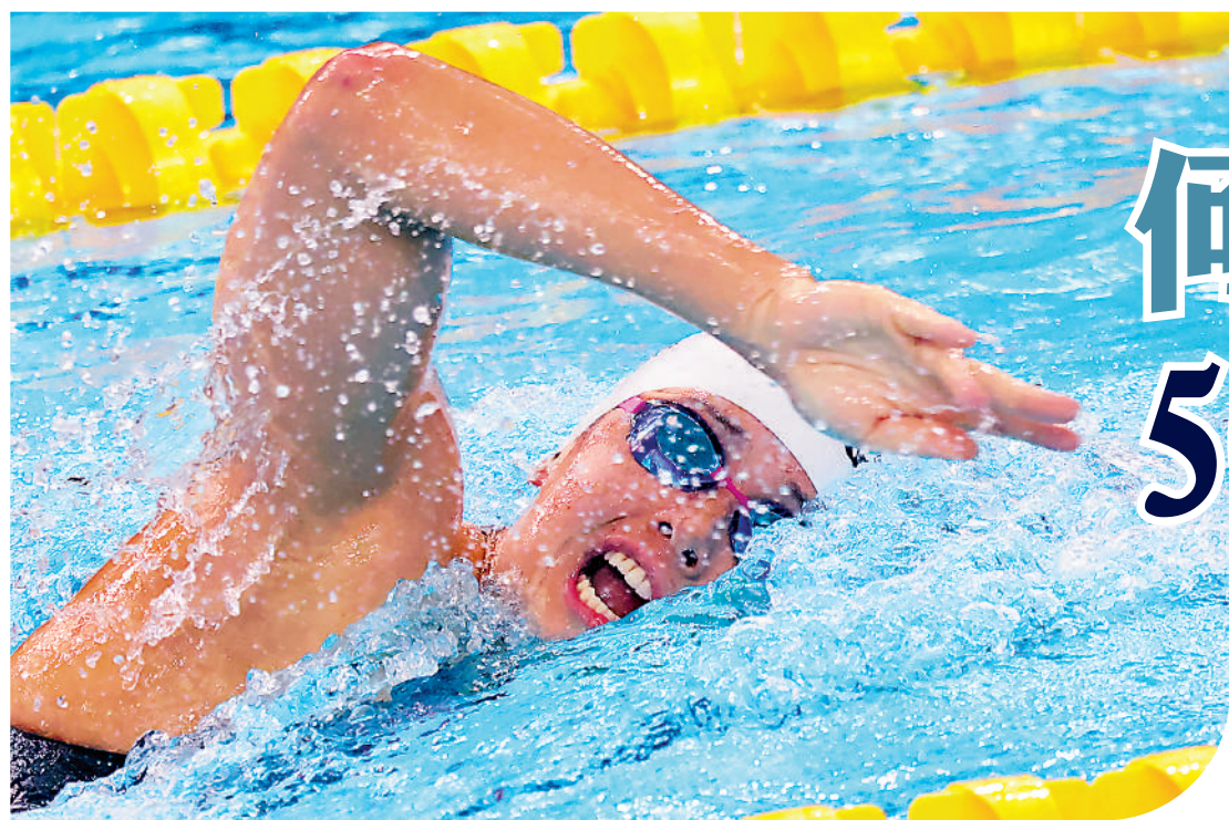
▲何詩蓓在比賽中全力爭勝。