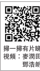
掃一掃有片睇 視頻：麥潤田 鄧浩明

「香港是我愛的城市，它很容易讓我有家的感覺，在這個世界上很難再找到一個地方能夠比得上香港。香港是一個非常熱情好客且充滿無限可能的地方，它提供一個平台讓夢想成真」，Gianni說。