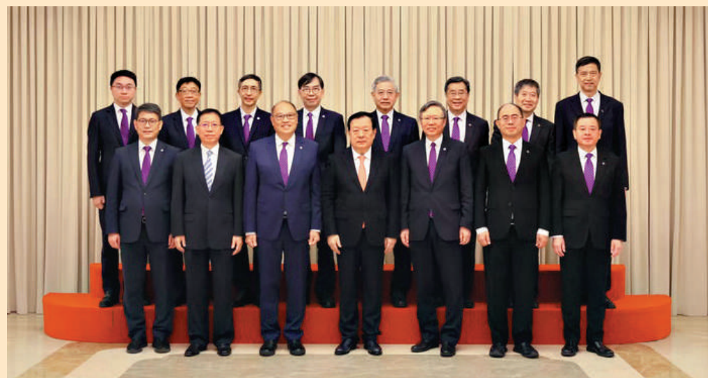
10月31日上午，中央港澳工作辦公室主任、國務院港澳事務辦公室主任夏寶龍在北京會見香港理工大學校董會主席林大輝、校長滕錦光一行。