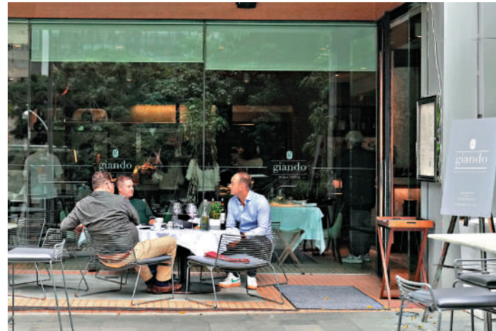
投資推廣署一直為Gianni擴展香港業務提供協助。圖為Gianni在灣仔的餐廳。