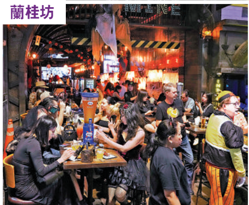
▲蘭桂坊酒吧生意好，比去年萬聖節旺場。