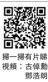
掃一掃有片睇 視頻：古偉勳 鄧浩明

內地速遞來港的偽造身份證，起回該批包裹再喬裝成速遞員，在全港各區的目標地點進行管控派遞包裹行動並作出拘捕，突擊搜查37個住宅單位及32個工作地點，成功拘捕52男45女，年齡介乎18至64歲，包括一名香港集團主腦、9名骨幹成員、67名懷疑非法勞工，以及20名涉嫌聘用非法勞工的僱主，共檢獲21張偽造香港身份證、18張偽證副本；內地執法機關亦搗破三個製作偽證地點，共拘捕104人，包括18名集團骨幹成員，並檢獲12台偽證製造設備。