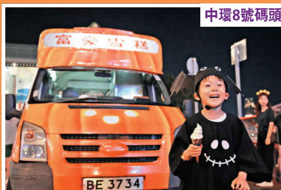
▲旅發局推南瓜造型雪糕車派雪糕。