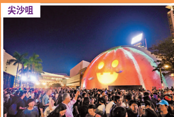
▲太空館「哈囉威香港」3D光雕匯演吸引大量觀眾。