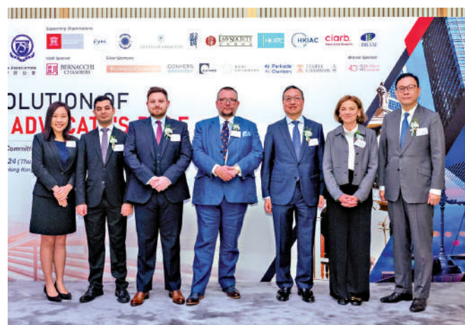
▲林定國（右三）昨日出席香港大律師公會新晉大律師常務委員會所舉辦會議，和與會者合影。

【大公報訊】記者龔學鳴報導：律政司司長林定國昨日出席香港大律師公會新晉大律師常務委員會所舉辦會議，他在會上分享其對成功律師必須具備的四個專業要素，又強調作為律師，肩負着對當事人，以至法律制度和整個社會的莊嚴責任。律師的信譽建基於對誠信的堅持，必須堅守。