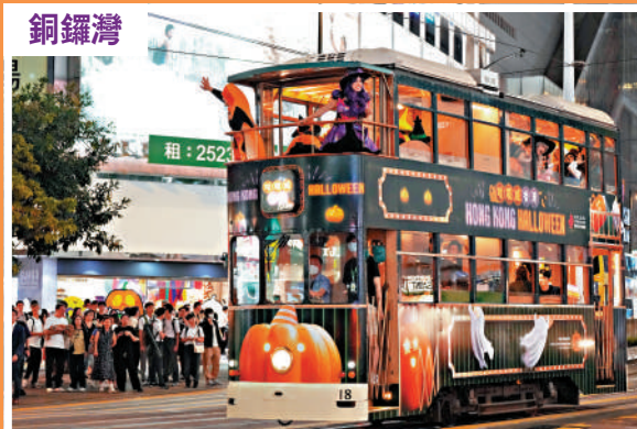
▲旅發局「哈囉威香港」電車巡遊。

海洋公園亦有哈囉喂全園祭活動，昨晚園內舉辦的OPPA Show吸引了不少遊客觀看。海洋公園表示，哈囉喂活動開始兩星期以來，入場人次和銷售情況均較去年同期增長。