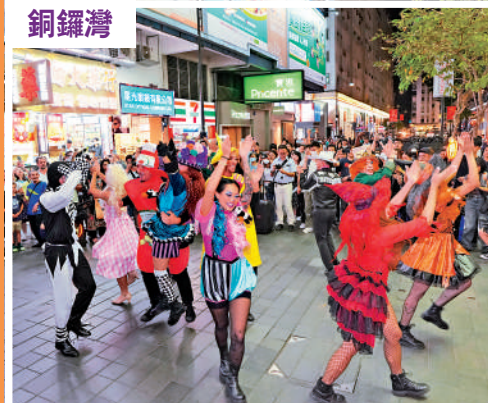
▲「嘩鬼」街頭快閃表演。